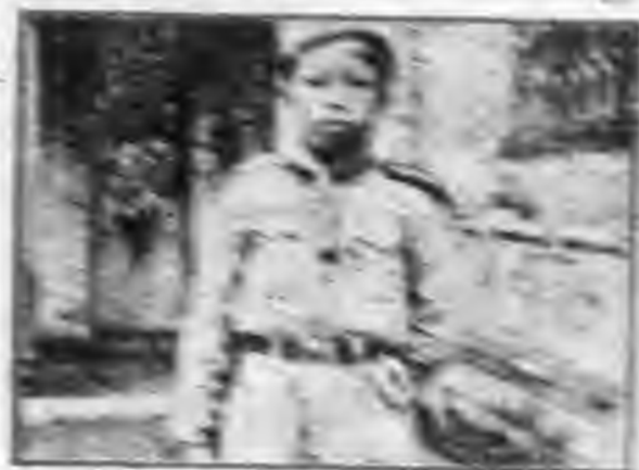
永寧保校四年級生