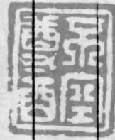
虎三口關手紋形圖