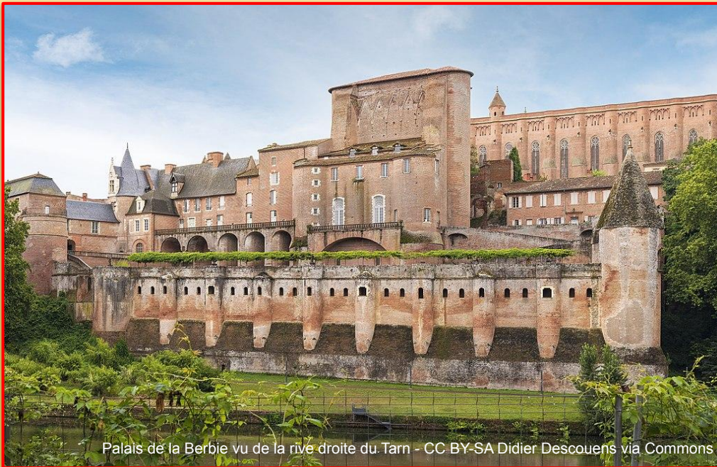
Palais de la Berbie vu de la rive droite du Tarn

onnées sur le patrimoine architectural français du