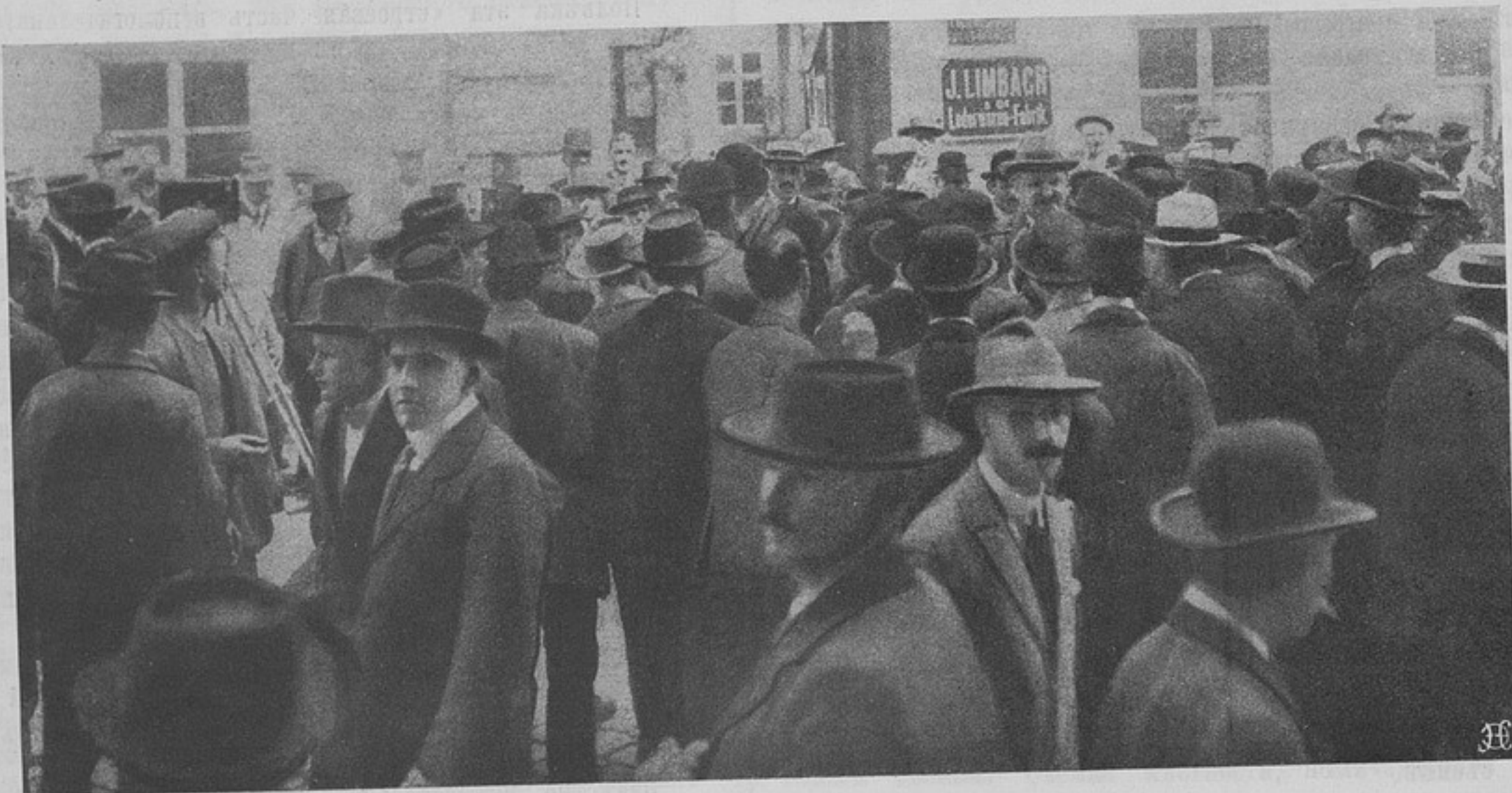
Вербовка волонтеровъ для Албаніи въ Вѣтнѣ.

Офицеръ, поступающій въ академію (штатнымъ слуша-