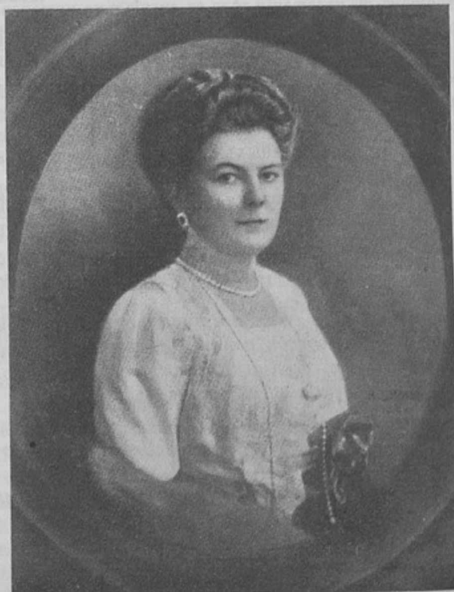
Наслѣдникъ австрійскаго престола, эрцгерцогъ Францъ-Фердинандъ и его супруга, герцогиня фонъ-Гогенбергъ, убитые въ Сараево.