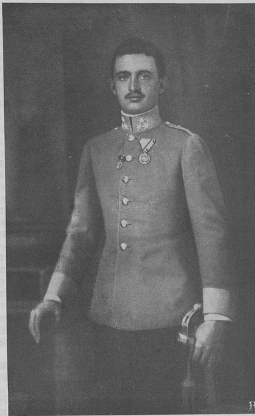
Новый наслѣдникъ австрійскаго престола, эрцгерцогъ Карль-Францъ-Иосифъ.

Во взглядахъ своихъ, какъ видитъ читатель, я сильно расхожусь съ идеями г. Надрубѣжнаго, категорически признающаго только компетенцію старшихъ.