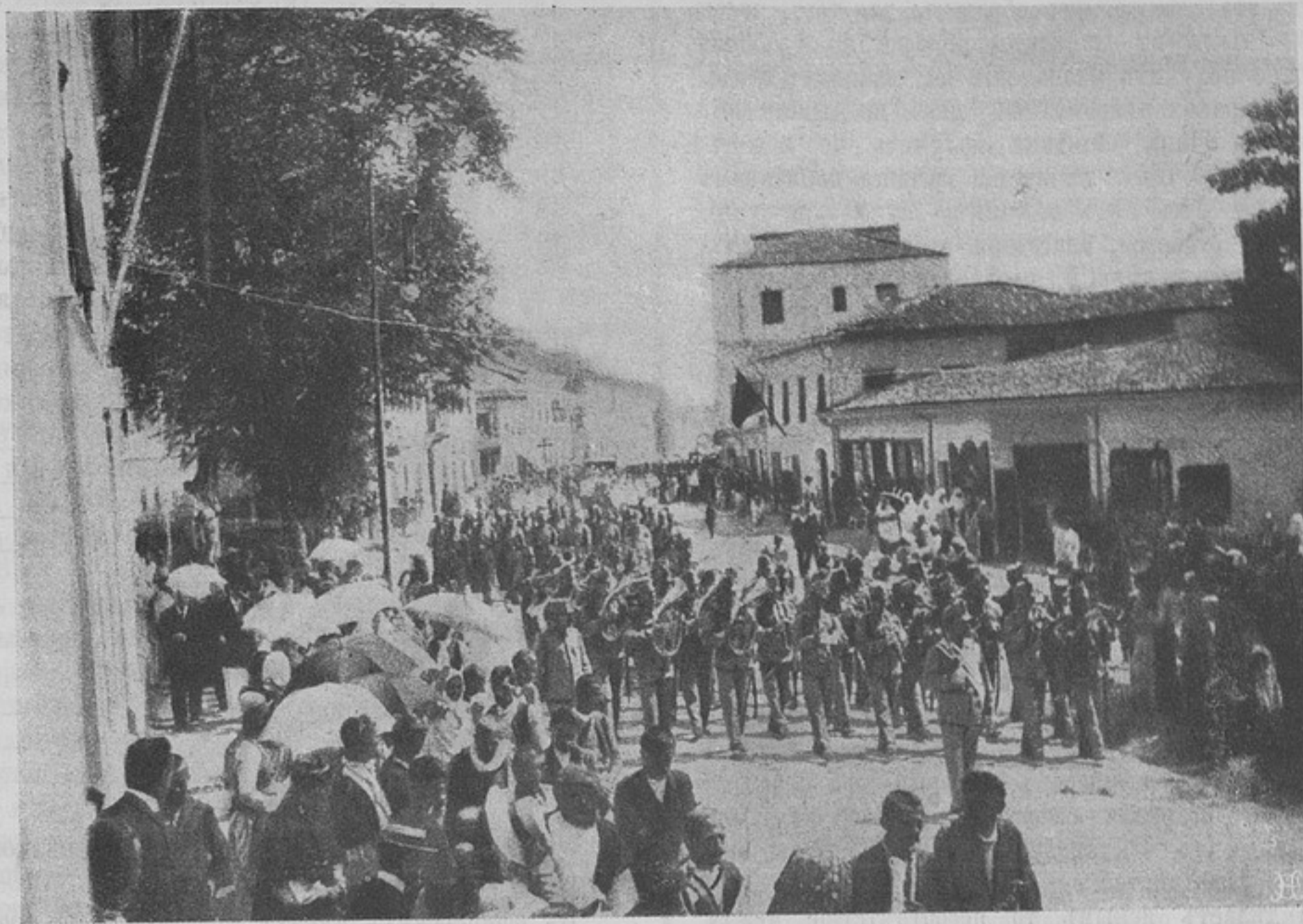
Церковная процессія въ Сараевѣ.

отъ 2-хъ до 3-хъ лѣтъ, въ зависимости отъ мѣста и личнаго счастья.