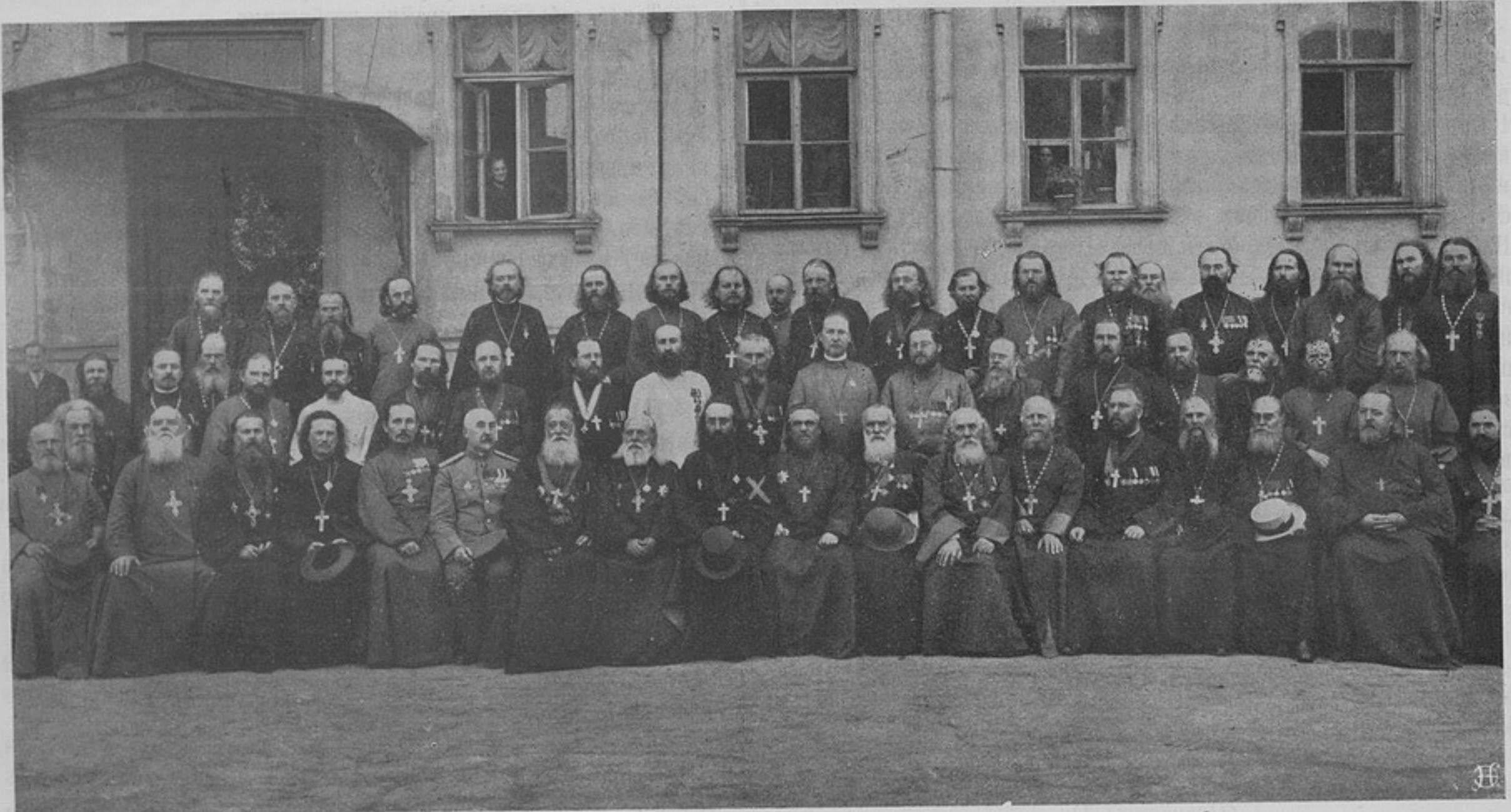
1-й Всероссийскій съѣздъ военнаго и морскаго духовенства въ Петербургѣ. × Въ центрѣ протопресвитеръ о. Георгій Шавельскій.

Произведя дознаніе, судъ чести въ этихъ случаяхъ дѣ-