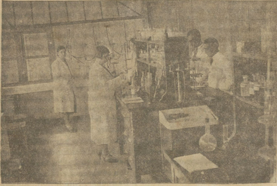
Müskirat İhisar idaresinin laboratuvarlarından birinde kimyager bey ve hanımın, içkileri tahlil ederlerken

İspirto ve içkiler, yerli fabrikalar tarafından imal edilmektedir - Şişe fabrikası neden yapılmadı?