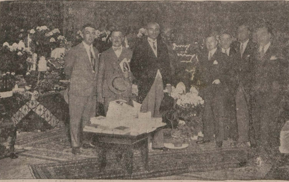
Breslâv sergisinde Türk pavyonunğa Ber lin Büyük Elçisi Kemalettin Sami Pa. ve Almanya'da Türk Ticaret Odası erkânı bir arada

Breslâv Sergisinde Türk pavyonunu ve millî mahsulât çok takdir kazandı