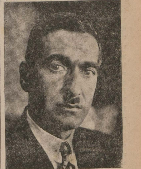
İstanbul Gümrükleri Başmüdürlüğü Sayfî B. filinde gümrükten gelen evrak: tah - Lütten Sayfeyi çeviriniz

Mahkemelere intikal eden da - valarda da gümrük memurları he - men kâmlen beraet etmekte ve mü - fettişler tarafından aylarca yapılan tahkikatlar hiç bir netice ver - mektedir. Bu sebeple adliye meha -