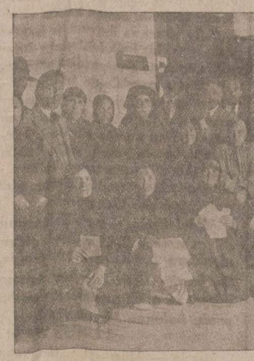
Dün mürracaat eden mübadillerden bir grup

Mübadillerin borçlarına mukabil taahhüt senedi vermek için verilen müddet dün akşam nihayet bitmiştir. Bu hususta Vali muavini Fazlı B. bir muharririmize şu iza-hatı vermiştir: