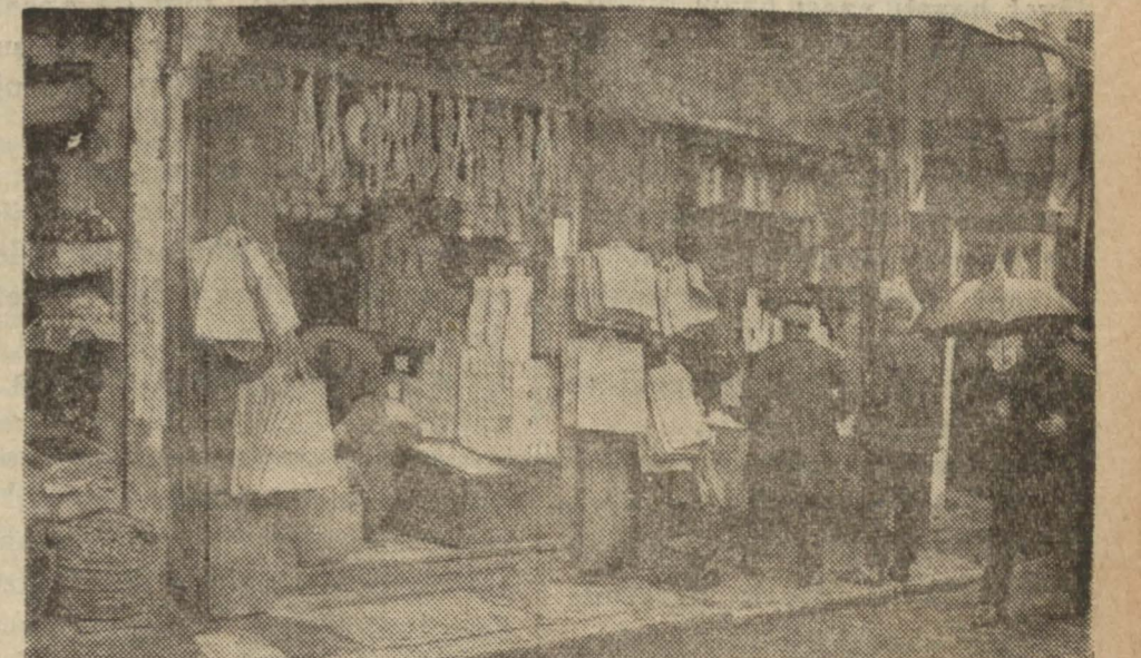
Farelerin taarruzuna uğrayan dükkânlardan birisi

Asmaaltı'ndaki zahire dükkânlarında fareler epeyce hasarat yaptılar