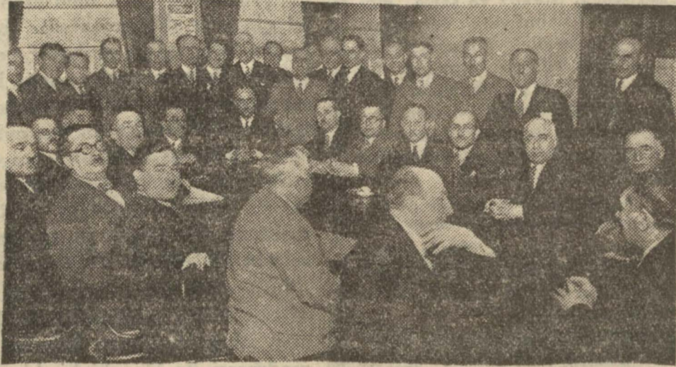
Dün İstanbul H. Fırkası merkezinde yapılan içtimadan bir intiba

Dün H. F. İstanbul merkezinde bir içtima yapılarak vaziyet görüşüldü