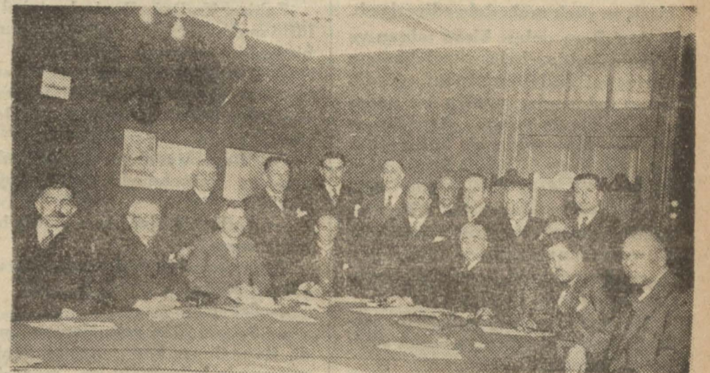
Şirket heyeti umumiyeye içtimada bulunanlar

930 senesinde liman faaliyeti ve şirket varidatı tenakus etmiştir