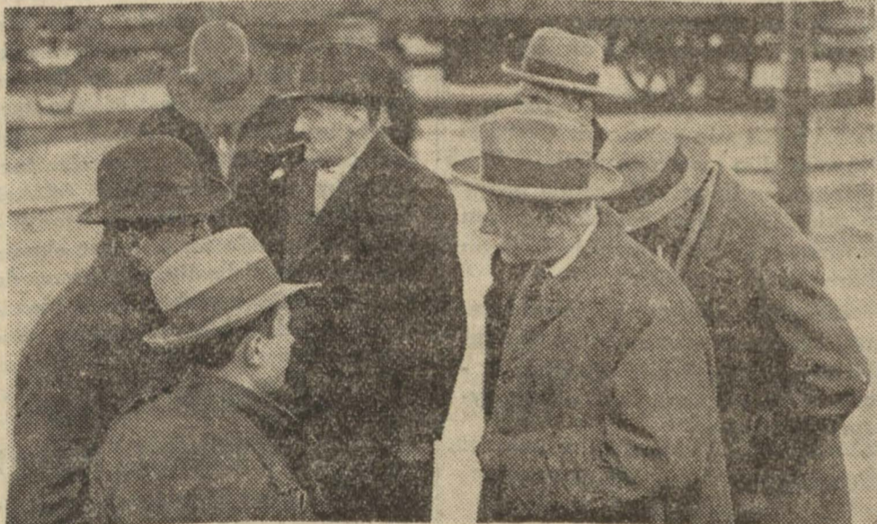
M. Con Masfild gazetecilerle konuşurken

İngiltere'nin meşhur şairi M. John Masfield dün Semplon ekspresile şehrimize gelmiş İstanbul İngiliz konsolosanesi erkânı tarafından karşılanmıştır. İngiliz şairi kendisile konuşan bir muharririmze demiştir ki: