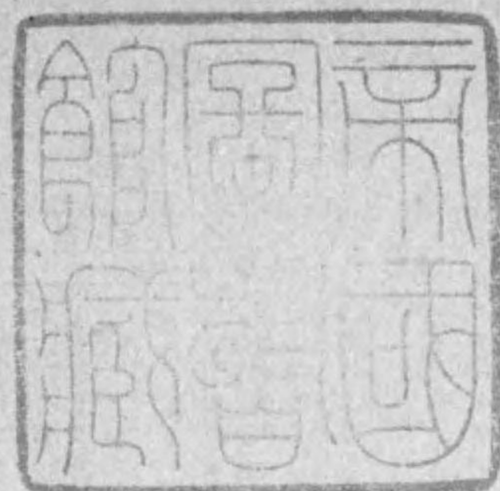
表 計 統