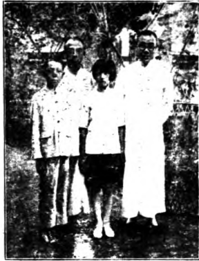
高教主任與本市小學聯合會全體合影

論，最喜有趣的故事與謎語。作者為適應兒童的這種心理，為使兒童得到一點教訓，行為上發生些微的變化起見，遂選購含有教育意味的小學公民訓練叢書講話（世界書局），用說故事的方式，利用訓練的時間，根據全校各級本週的中心訓練，分別講述。兒童需要什麼材料，我們就給他們說什麼的故事。發見了兒童有說謊的行為，就給他們講述誠實的故事；發見了兒童有偷懶的惡習，就給他們講述勤勉的故事；如此種種，不一而足。大胆試驗，小心求證，結果頗稱圓滿，至少我是如此感覺的。這一種訓導的方法，我總認為比那些以道學家的面孔，講述些道德的名詞好得多。雖不直接給兒童下一結論，而兒童心性與品性，亦受到很大的影響了。 一九三五，九，三。