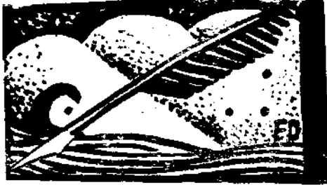
白 筆 伐 丁

，把它改名桃花江，桃花盛開的時候，固然遊人比肩接踵，現在桃花雖謝，而河中游艇，林中遊客，仍自十分踴躍。」；一二八殉國戰士們的血灌溉出來的是什麼呢？——桃花江。