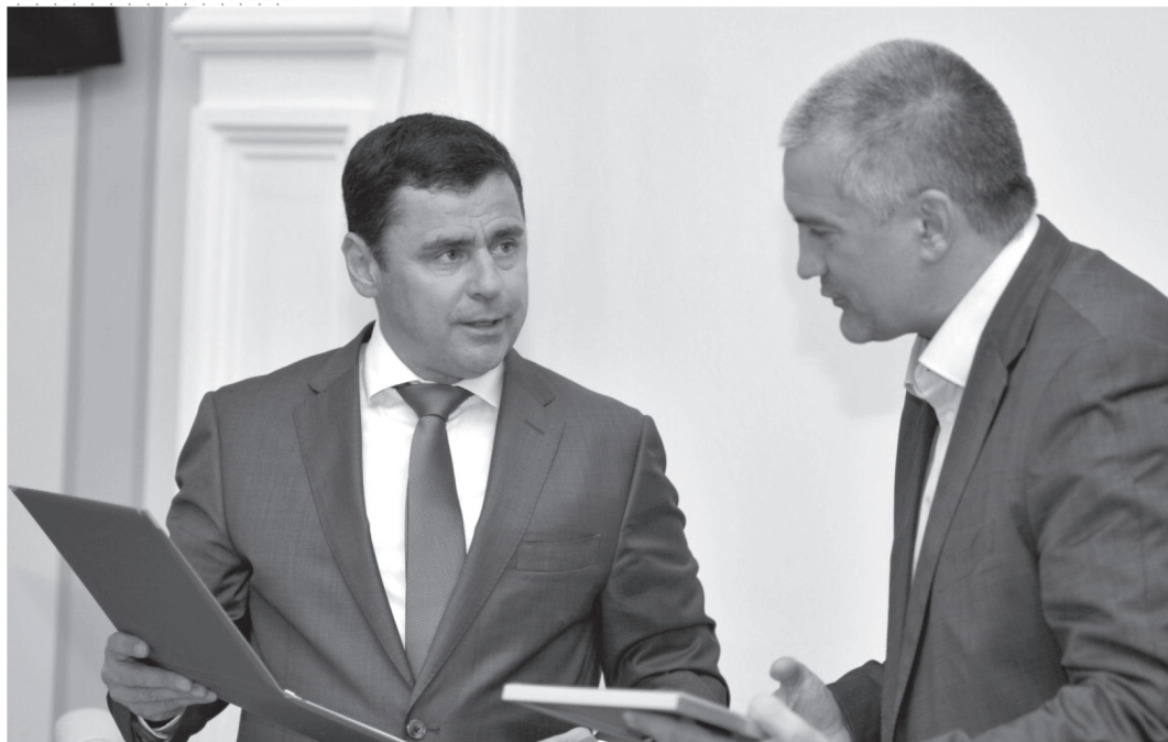
Глава региона Дмитрий Миронов и глава Республики Крым Сергей Аксёнов подписали протокол о намерениях

РЕГИОНЫ ДОГОВОРИЛИСЬ О СОВМЕСТНОМ СТРОИТЕЛЬСТВЕ СКОРОСТНЫХ СУДОВ, ВЫРАЩИВАНИИ КАРТОФЕЛЯ, ПОДДЕРЖКЕ КРЫМСКОЙ ЭНЕРГЕТИКИ