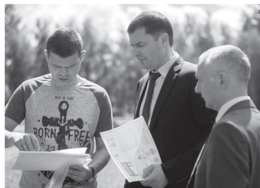
Строительство пришкольного стадиона в Переславле-Залесском

Школа № 4 — ресурсный центр района. На её базе созданы кадетские классы. Многие её выпускники в дальнейшем связывают свою жизнь с военной службой. Физпод-