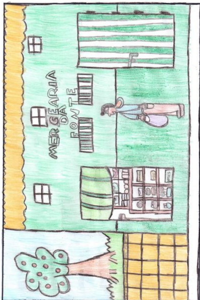
! Sabrina e sua mercancia da fonte