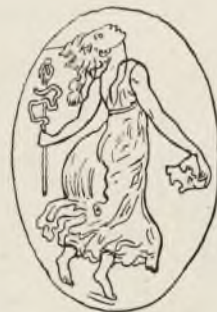
Паста (гемма изъ массы), изображающая Менаду съ тирсомъ — въ изступленіи. (Британскій музей).

Кто не занимался тогда рѣзбой на драгоценныхъ камняхъ? Искусство это стали изучать многія знатныя лица, даже женщины. Такъ, мадамъ де-Помпадуръ училась ему подъ руководствомъ знаменитаго артиста въ этой области Жана Гюэ. У насъ успешно занималась тѣмъ же Великая Княгиня Марія Теодоровна, супруга Наслѣдника Цесаревича Павла Петровича, учителемъ которой былъ извѣстный К. А. Лебрехтъ (1749 — 1827), бывшій главный медальеръ С.-Петербургскаго Монетнаго Двора. Великой Княгиней изготовлены были превосходныя геммы на двухъ и трехслойномъ ониксѣ, находящіяся нынѣ въ коллекціи Императорскаго Эрмитажа: это портретъ Императрицы Екатерины II въ шлемѣ въ видѣ Минервы, свой собственный портретъ и портретъ Павла Петровича. Камни вырѣзаны такимъ образомъ, что фонъ камня остается темнымъ,