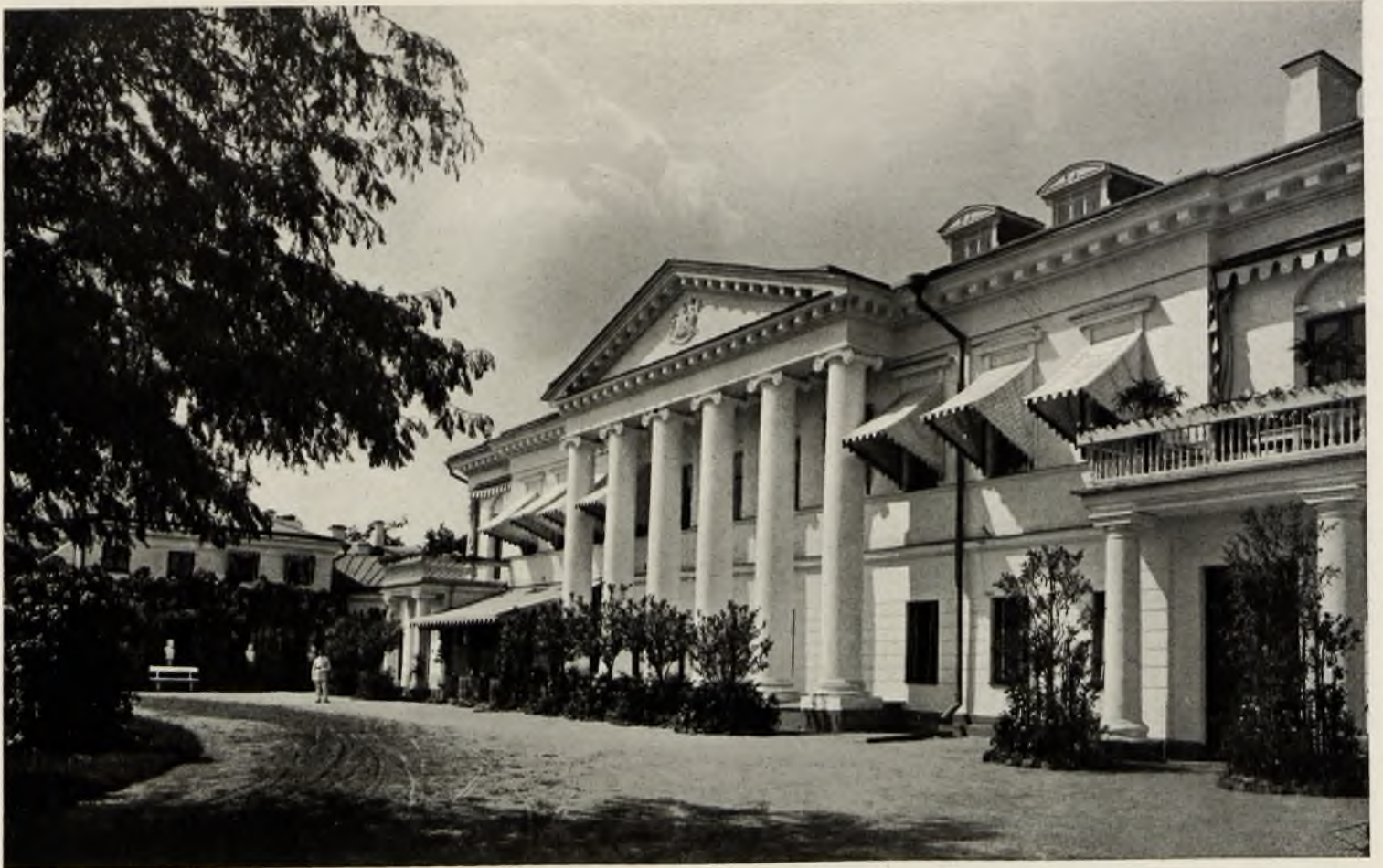
Диканька. Фасадъ главнаго дома.