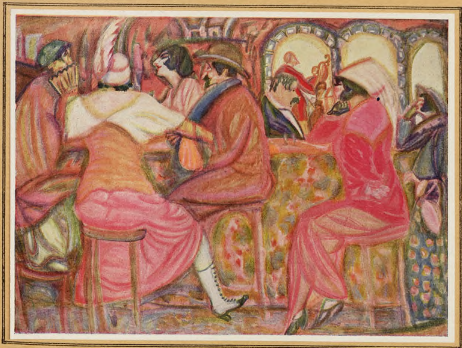
Б. А. Григорьевъ—„Въ парижскомъ кафе“.