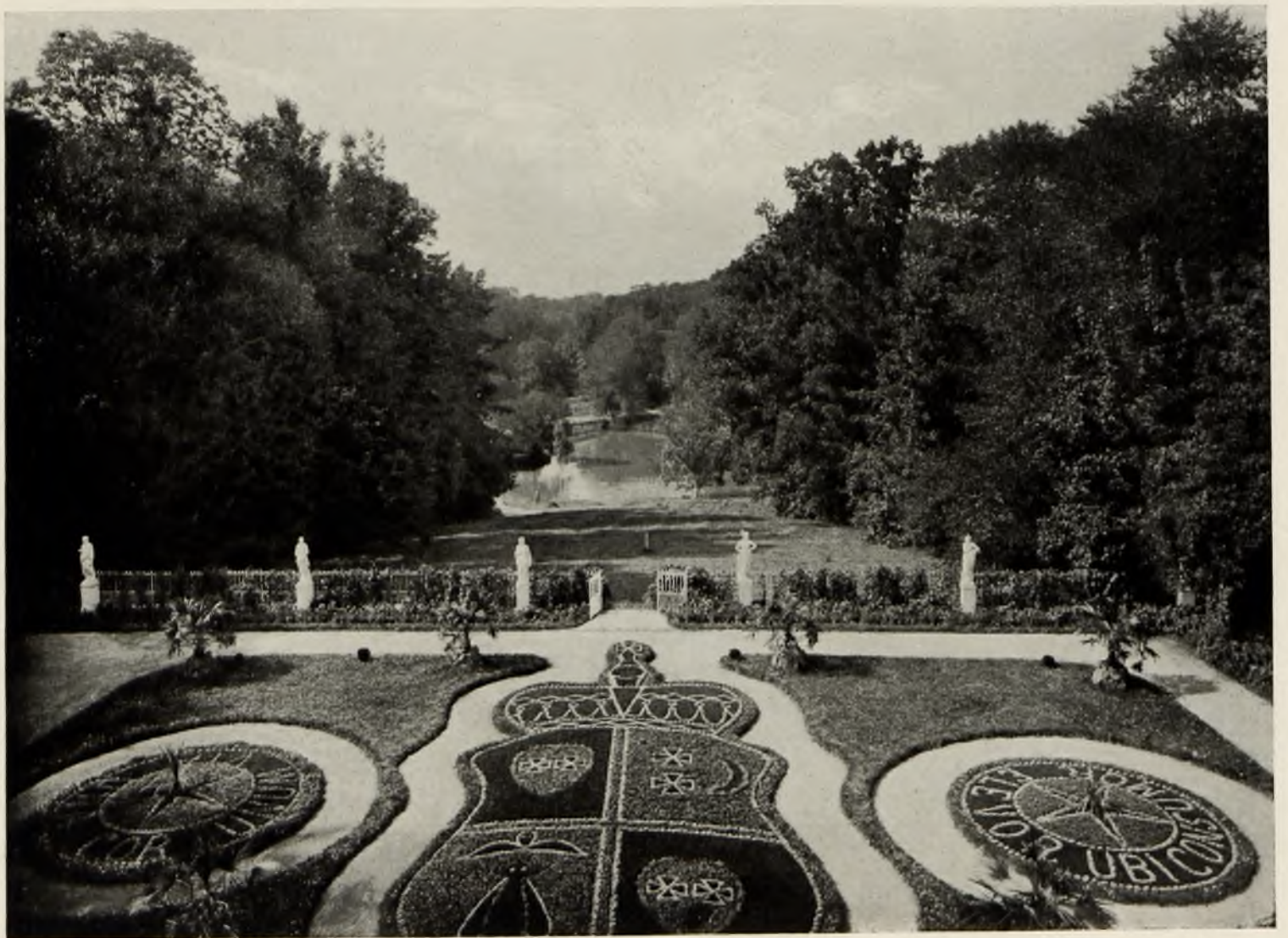
Цвѣтникъ въ саду, вдали—прудь; по- среди́нѣ газонный гербъ князей Кочубеевъ.