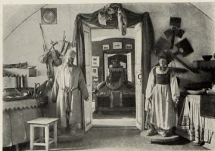
Музей Вѣлоруссіи; въ глубинѣ— тронъ-кресло Екатерины II, на которомъ она сидѣла при приѣмѣ германскаго принца, пріѣзжавшаго сюда.