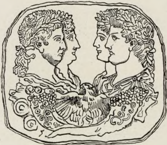
„Гемма Клавдія“ — ониксовый камей изъ вѣнской коллекціи: семейство императора Клавдія. Слѣва Клавдій и Мессалина, справа Тиверій и Ливія. (11 сант. шир. × 8 сант. выс.).