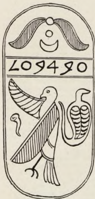
Финикийскій скарабей — въ видѣ агатовой печати, съ египетскими эмблемами (соколъ и урей) и надписью финикийскими буквами: „Абд-бааль“. (Парижскій „Кабинетъ медалей“).