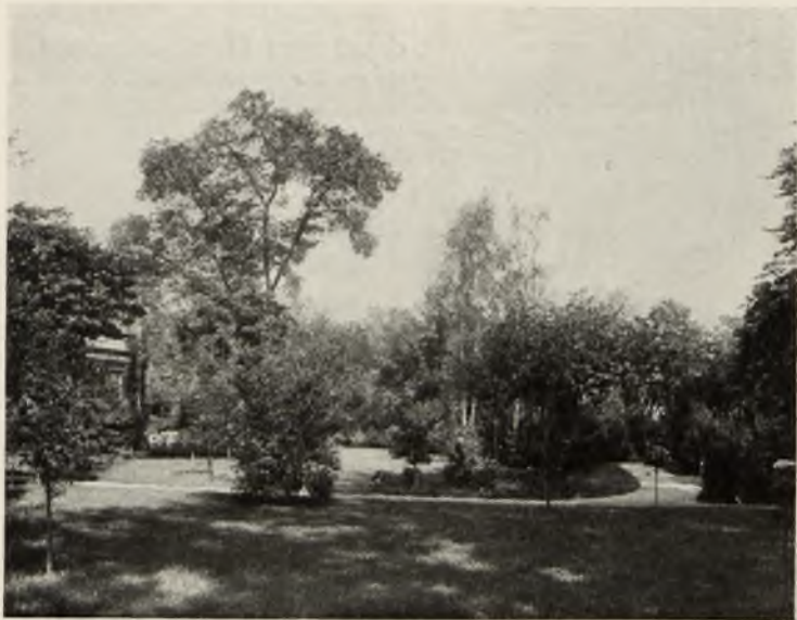
ОСОБНЯКЪ Ю. М. КЕТНИЦА ВЪ ЦАРСКОМЪ СЕЛѢ.