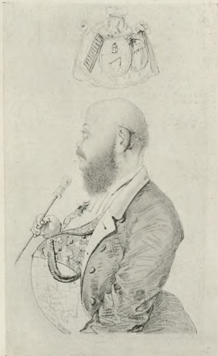
Карикатура на тамбовскаго помѣщика; гербъ, соединяющій кнутъ, счеты и денежный мѣшокъ; на животѣ карта Тамбовской губерніи...