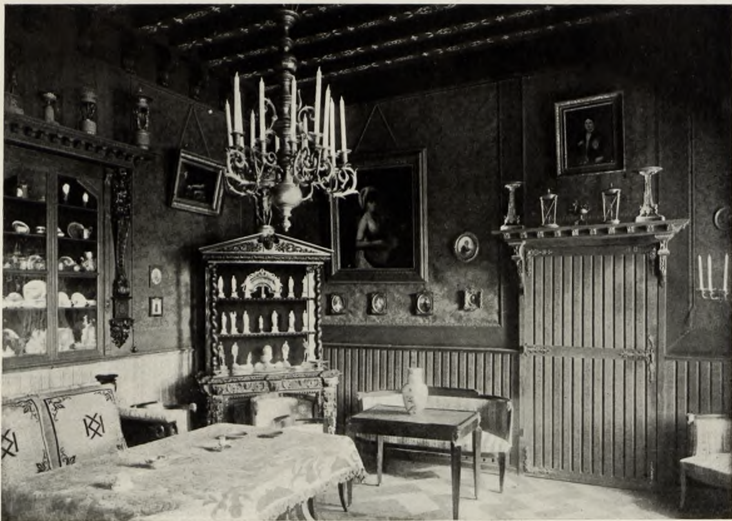
Диканька. Музейная комната.

была двумя годами моложе поэта и жила тогда въ Царскомъ Селѣ. „Едва ли не она была первымъ предметомъ любви Пушкина“, писалъ одинъ изъ его товарищей. Къ ней относится стихотвореніе „Измѣны“, и несомнѣнно она фигурируетъ въ „Донъ-Жуанскомъ спискѣ“ Пушкина подъ именемъ „Натали I“; впоследствии она была замужемъ за графомъ А. Г. Строгановымъ, министромъ