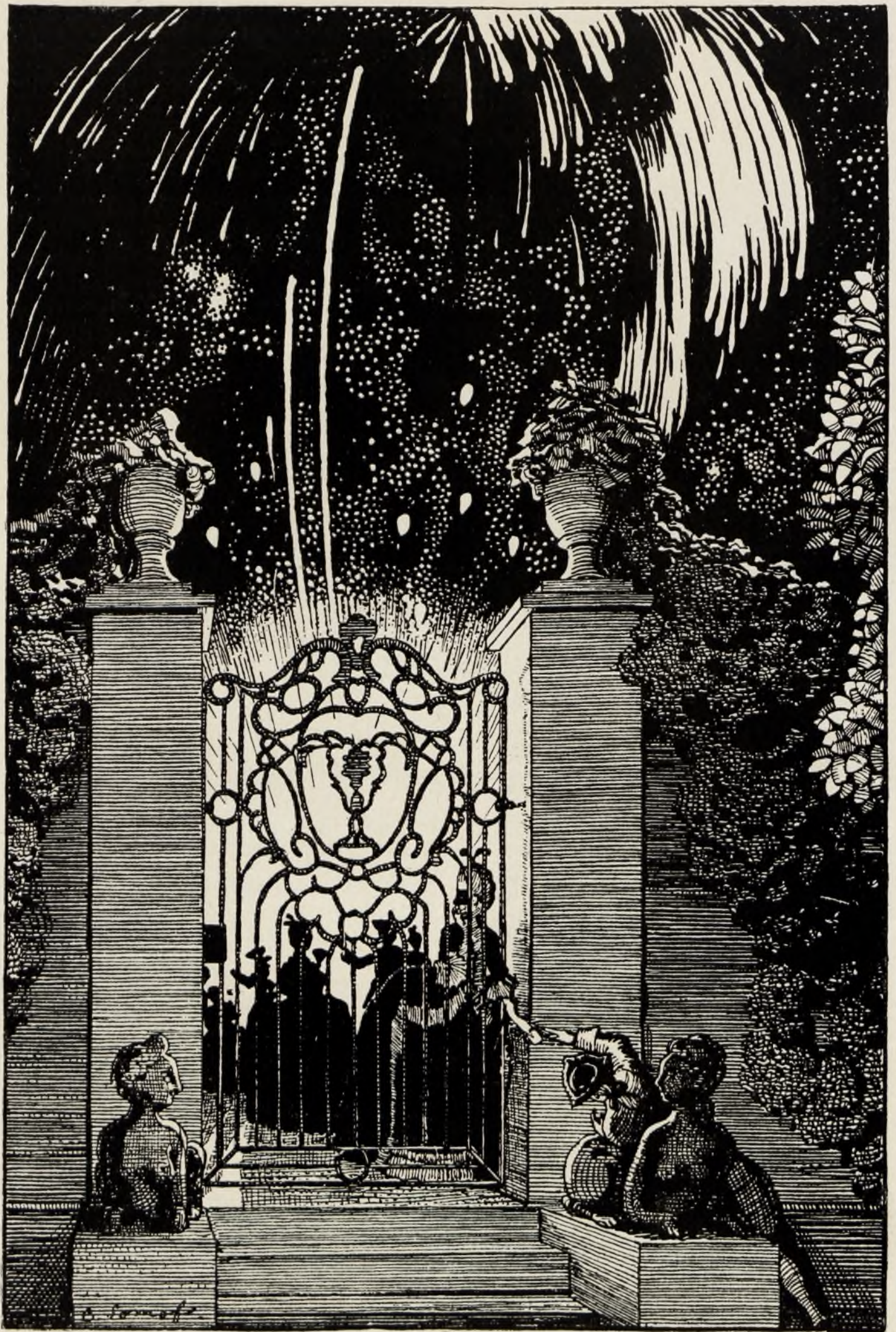
„Фейерверкъ“, рис. К. Сомова.

(Изъ сборника „Книжка для чтенія Маркизы“).