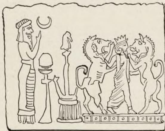
Цилиндрическая Ассиро-Персидская гемма: жертвоприношеніе, царь борящійся съ двумя львами, у которыхъ человѣческія лица. Амулетъ въ видѣ печати. (Британскій музей).

дующемъ XVIII вѣкѣ, покровительствуемое королями, аристократами и меценатами.