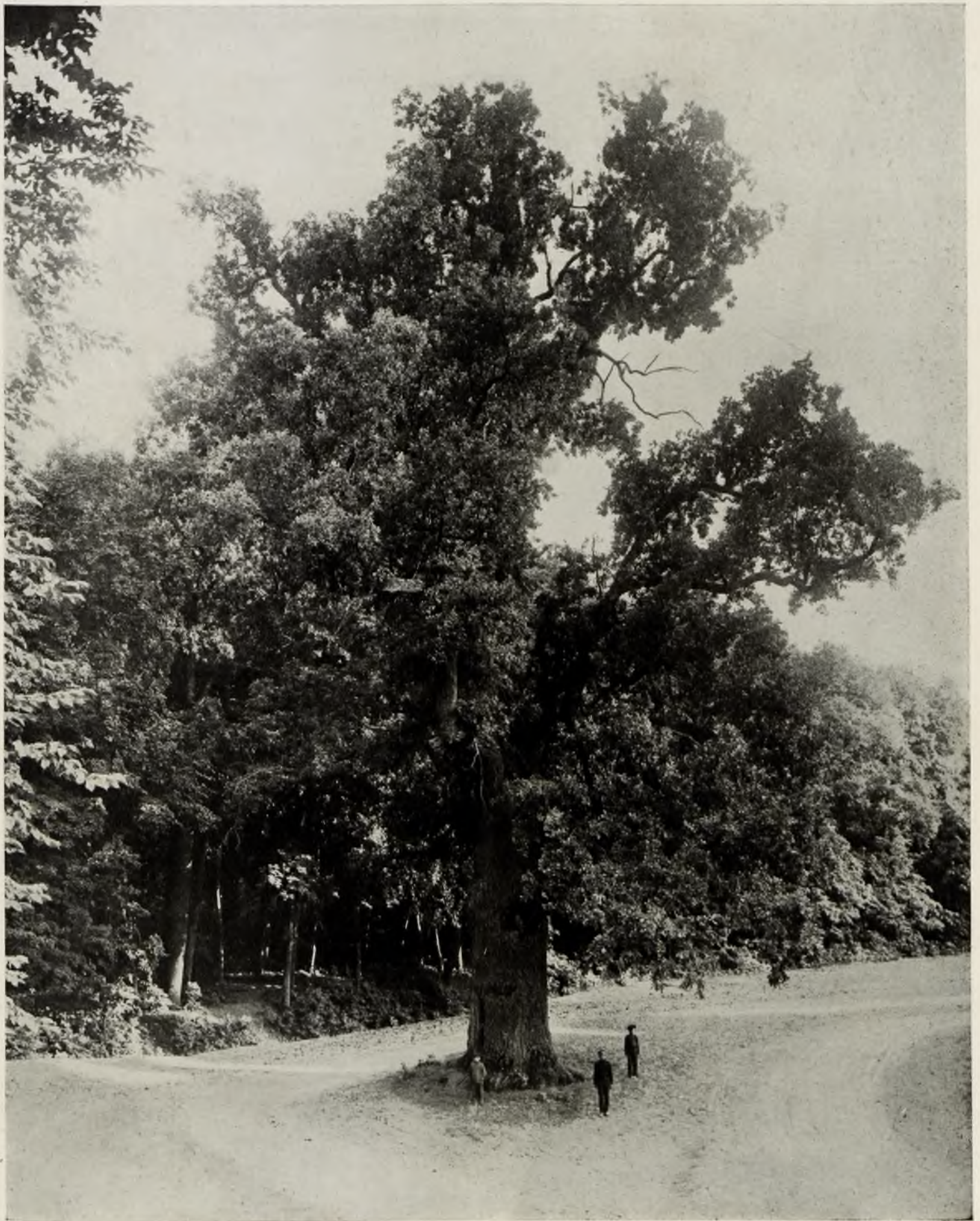
Диканька. Одинъ изъ знаменитыхъ дубовъ-великановъ, воспѣтыхъ еще Пушкинымъ.