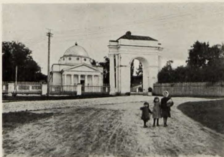
Соборъ Св. Іосифа и брама (арка) Екатерины II.