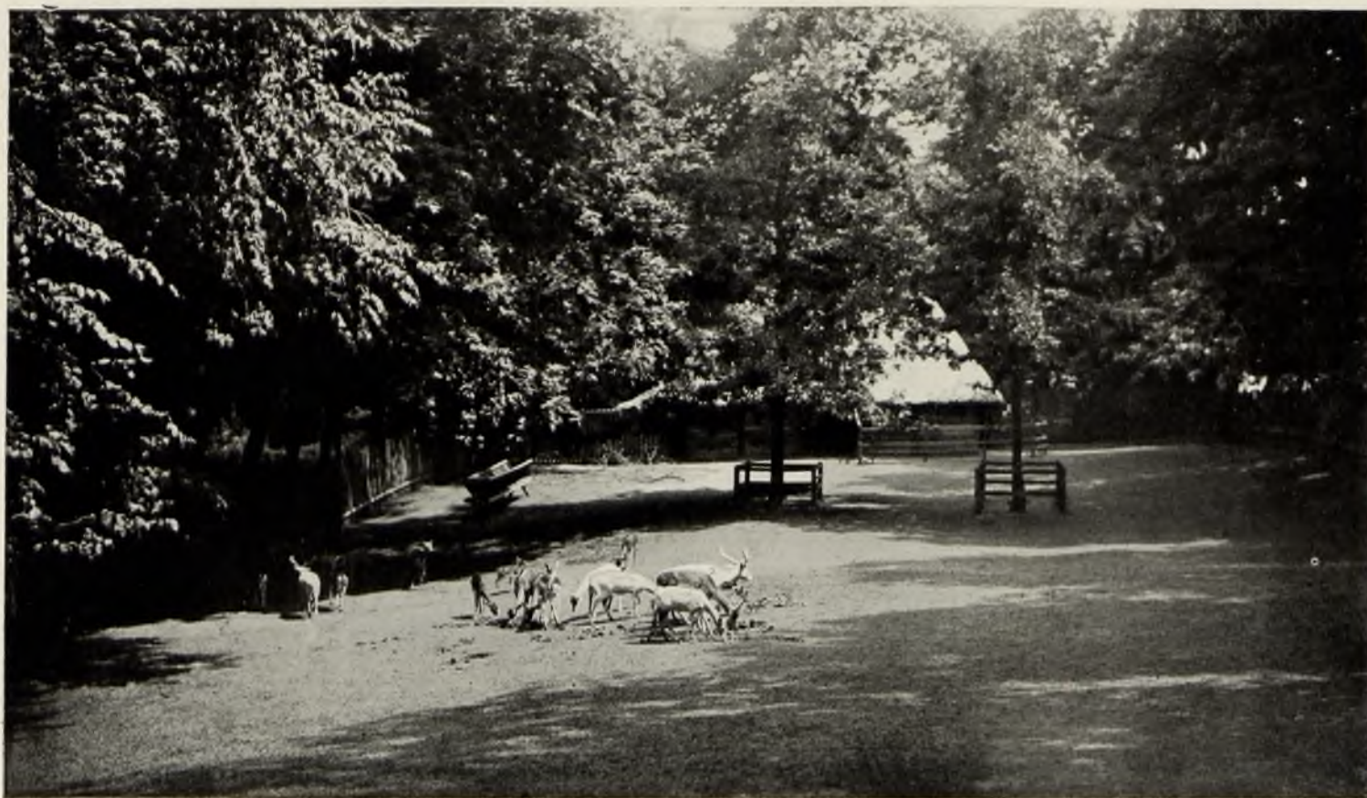
Оленникъ въ Диканькѣ.

Перепечатка безъ указанія источника воспрещается; пе- репечатка группъ и портре- товъ вообще воспрещается. Законъ 20 марта 1911 года.