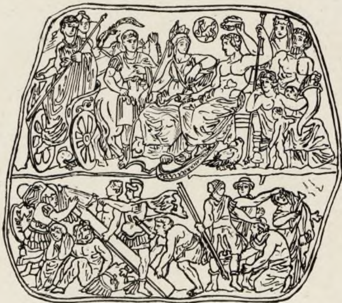
„ Августовская гемма “ ( Gemma Augustea ) изъ оникса, изображающая апофеозъ Августа: сверху Августъ на тронѣ, рядомъ съ боиней Рима; передъ нимъ Германикъ и сходящій съ колесницы Тиверій. Внизу солдаты, приотворяющіе триумфъ. Высота около 9 дюйм. (Вѣнская коллекція).

а на немъ въ верхнихъ, свѣтлыхъ слояхъ выгравированы лица (портреты).