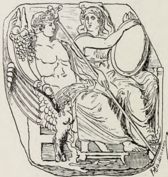
Ониксовый камей — Августъ на тронѣ, рядомъ съ боиней Рима (Roma). Вѣнская коллекція.

У насъ въ Россіи, какъ и на западѣ, существуетъ еще не одна коллекція геммъ среди богатыхъ собирателей, владѣльцевъ старинныхъ фамильныхъ замковъ и дворцовъ съ ихъ картинными галереями и фамильными рѣдкостями. Но, какъ бы то ни было, большинству теперь приходится ограничиваться въ лучшемъ случаѣ хорошими копіями, приготовленными помощью смѣси изъ гипса и воска. Существуютъ также стеклянныя геммы, особенно въ Италіи, нерѣдко превосходной работы. Что касается самой техники исполненія рисунковъ на камняхъ, то, какъ было сказано, она мало измѣнилась съ древнѣйшихъ временъ и какъ тогда ограничивается все еще цѣлой системой острыхъ и закругленныхъ металлическихъ стержней, которыми, помощью приспособленій съ передаточными ремнями, придаютъ быстрое вращательное движеніе и соприкасаются осторожно съ камнемъ, постепенно выдалбливая на немъ рисунокъ, предварительно выѣпленный изъ воска. Приступаютъ къ работѣ этой, смазывая концы инструментовъ масломъ, обматывая ихъ ватой и протирая тѣ или другія мѣста наждачнымъ порошкомъ. Пихлеръ изготовлялъ одну гемму въ продолженіе шести лѣтъ; надо полагать, что многія знаменитыя геммы древности стоили не мало времени добросовѣстнымъ и терпѣливымъ своимъ авторамъ. Что касается разныхъ надписей на геммахъ, то, не говоря уже о томъ, что множество таковыхъ является апокрифическими, раз-