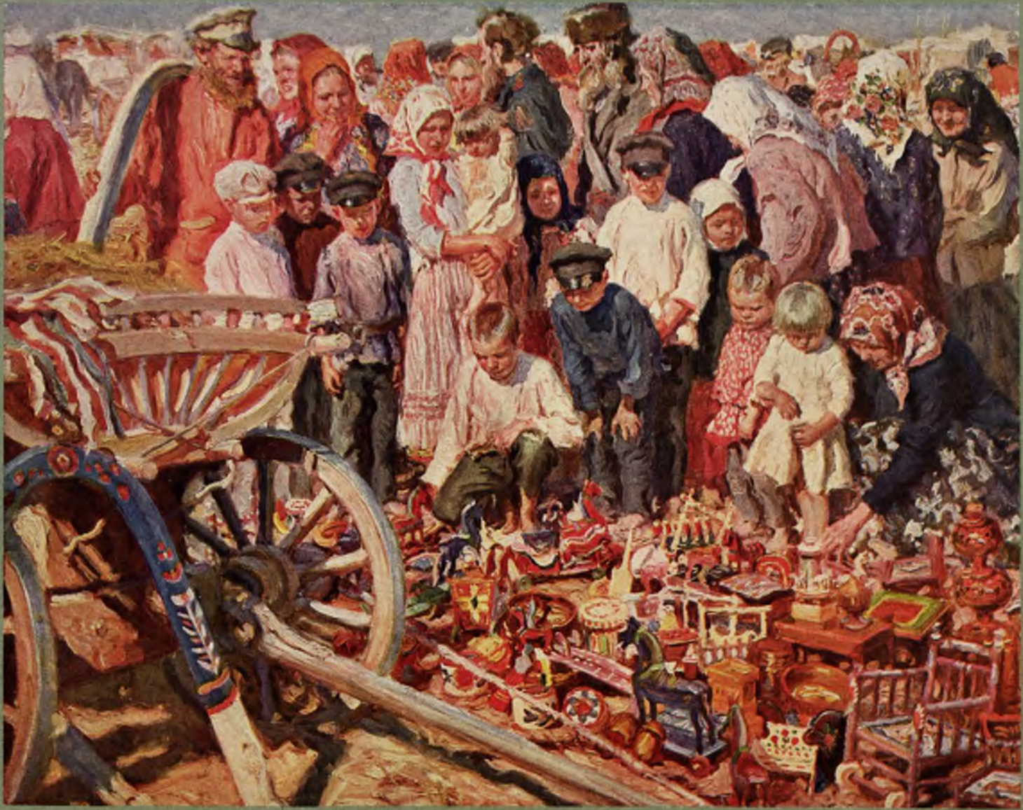
А. В. Моравовъ—„Игрушки“. Весенняя выставка 1916.