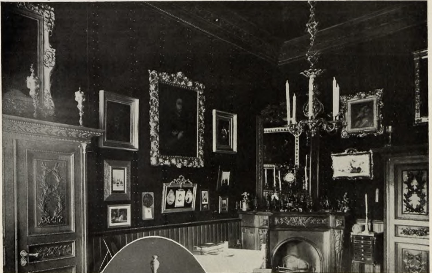
Диканька. Уголок кабинета княгини Елены Конст. Кочубей.

строение, которое отличало семью, давшую миру Гоголя.