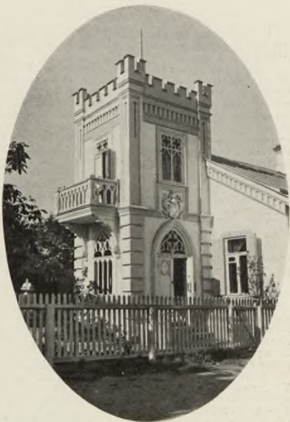
ОСОБНЯКЪ В. Ф. ЧАРНЕЦКАГО ВЪ КІЕВѢ.