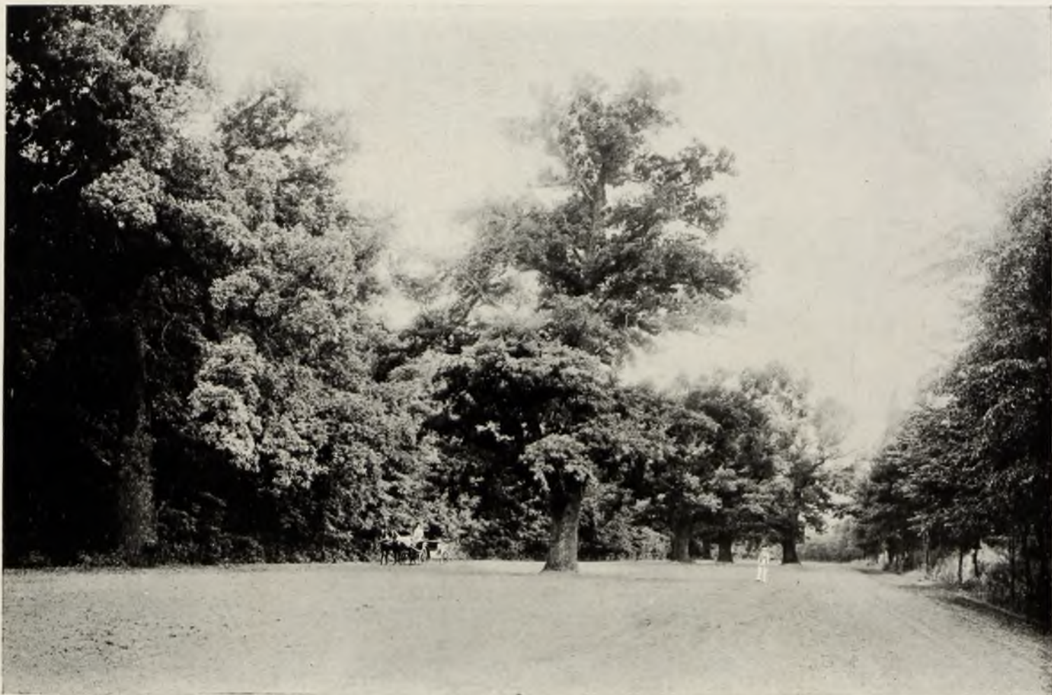
Дорога въ Диканьку—знаменитые дубы.

Перепечатка безъ указанія источника воспрещается; пе- репечатка группъ и портре- товъ вообще воспрещается. Законъ 20 марта 1911 года.