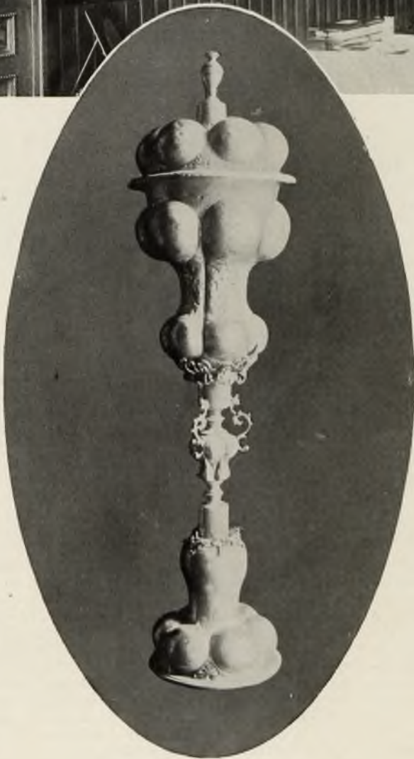
Диканька. Одинъ изъ фамильных кубковъ; подпись на немъ:

онъ самъ въ послѣдствіи расписывалъ, уже не существуетъ, и вся гоголевская усадьба распланирована по-новому, исчезъ и тѣнистый