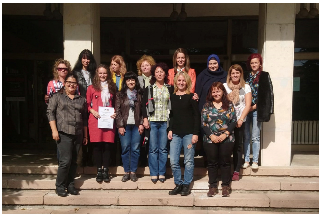
Регионална библиотека „Николай Вранчев“, Смолян