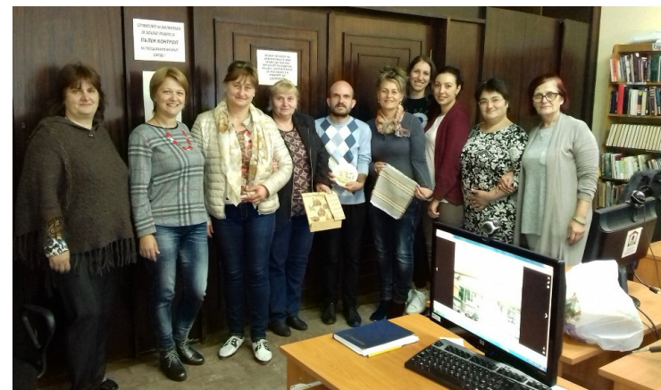
Регионална библиотека „Михалаки Георгиев“, Видин