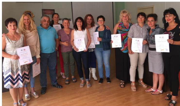
Регионална библиотека „Никола Фурнаджиев“, Пазарджик