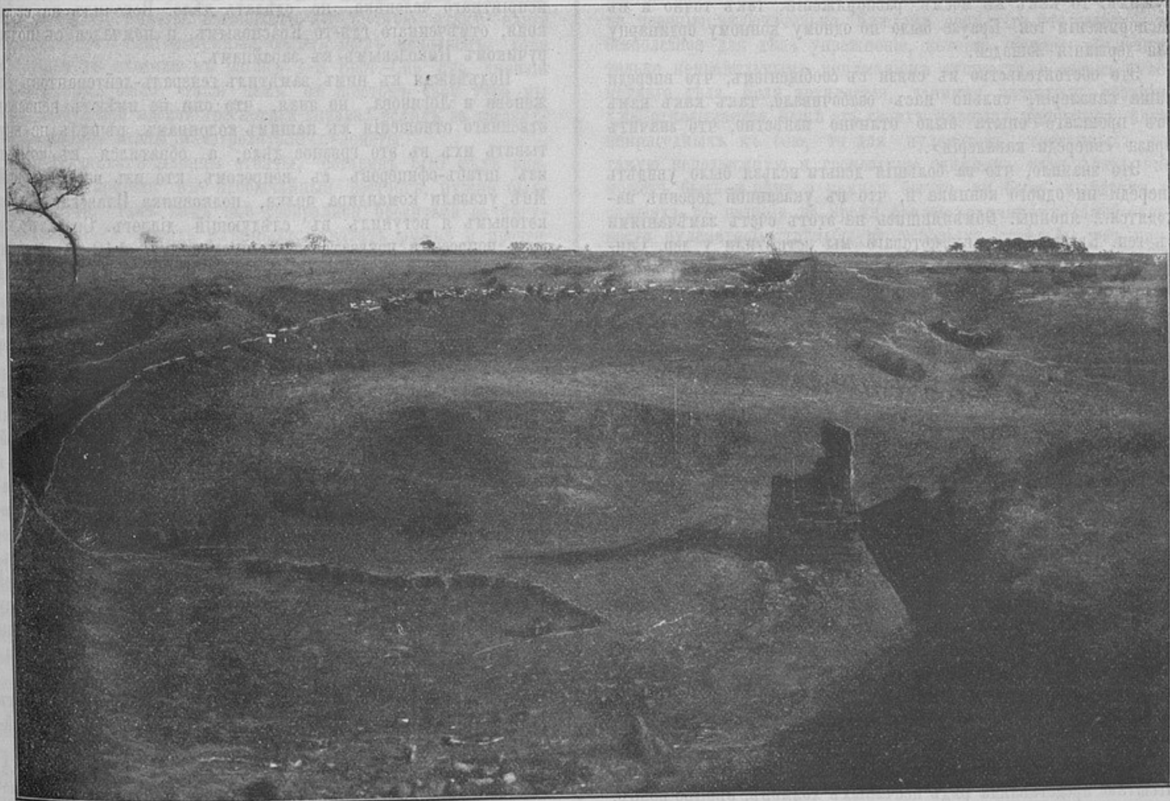
Внѣшній видъ современныхъ окоповъ. Окопъ 11-го пѣх. Псковскаго полка, подъ Линшиппу.

Да послужить это соображеніе утѣшеніемъ для однихъ и огорченіемъ для прочихъ, хотя нельзя не сознаться, что утѣшеніе это плохого свойства такъ какъ черезъ 20 лѣтъ разныя ваше-ства, украшенные орлами и прочими знаками за то, что въ былое время отлично варили шоколадъ и готовили шашлыки, ила за то, что не хотѣли уѣзжать изъ арміи, не получивъ золотого оружія за... сидѣніе въ пульмановскомъ вагонѣ, сойдутъ уже въ могилу, увѣренные, что они-то и есть великіе люди, а такъ какъ мы не китайцы и не занимаемся разжалованіемъ предковъ-покойниковъ, то всѣ па-