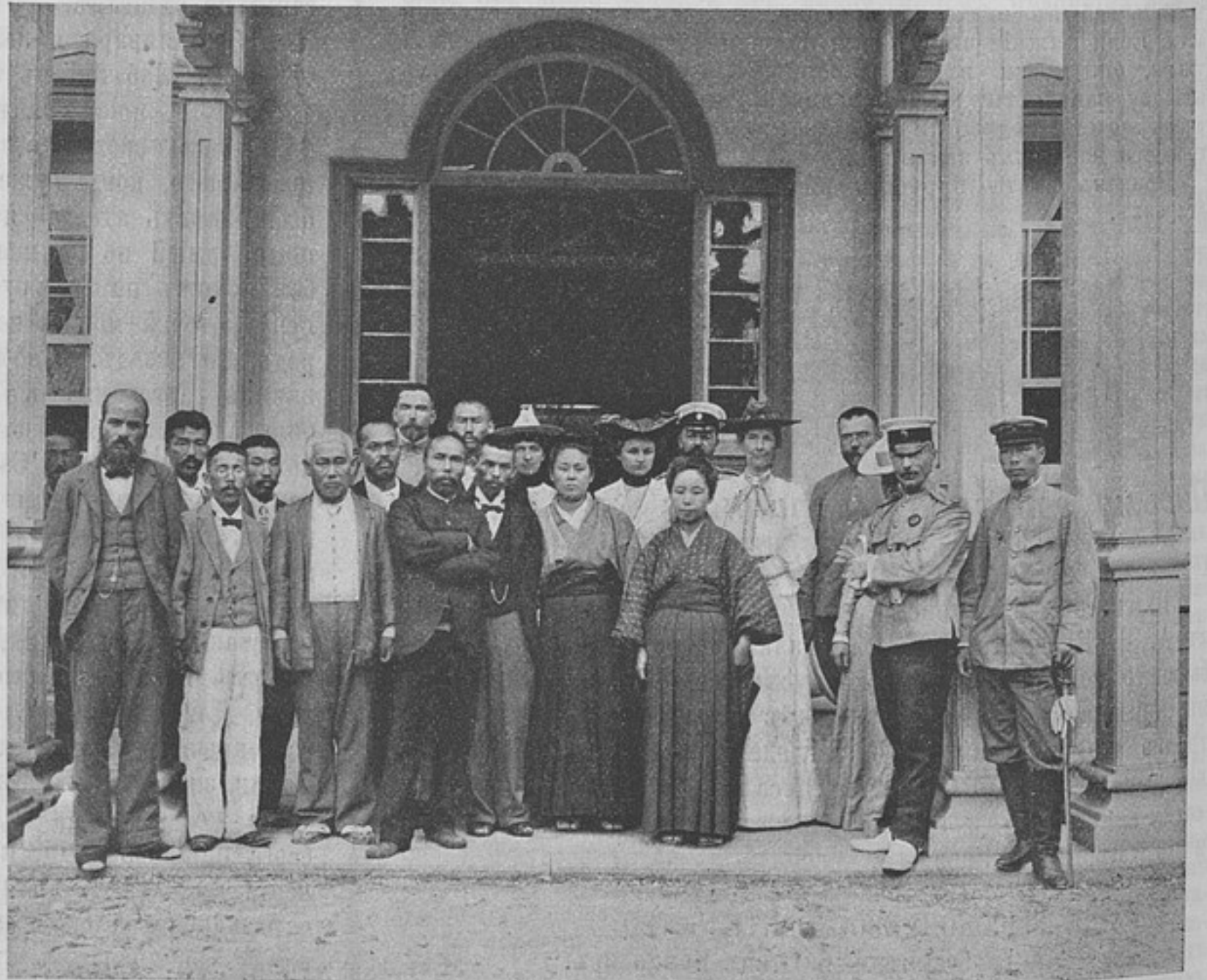
Изъ жизни русскихъ плѣнныхъ въ Японіи. Мацуяма. Преподаватели Сиханъ-ганко (школа).