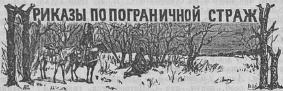
Юля 2-го дня, въ Петергофѣ.