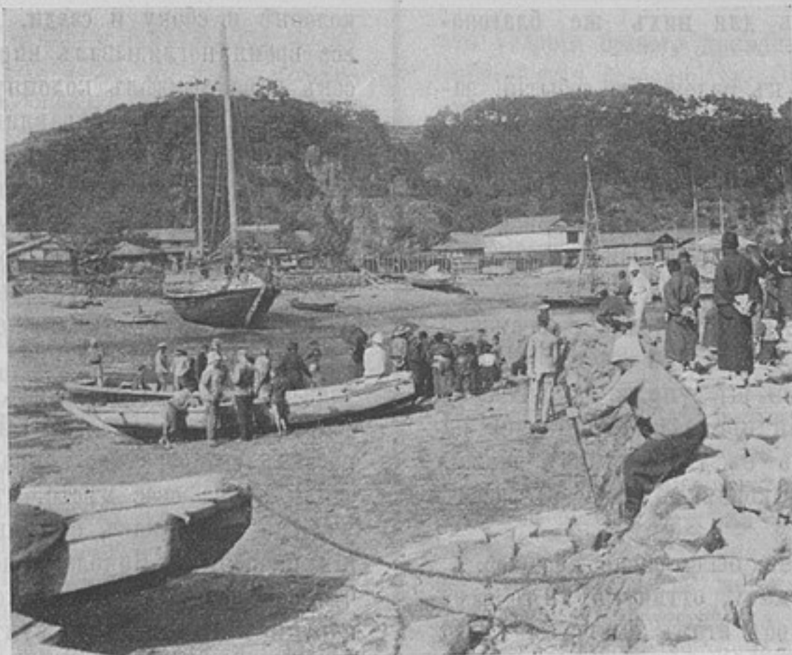
Изъ жизни русскихъ плѣнныхъ въ Японіи. Набережная въ г. Гунчу.

31-го января 1905 г. Бивакъ у д. Даджоунхе.