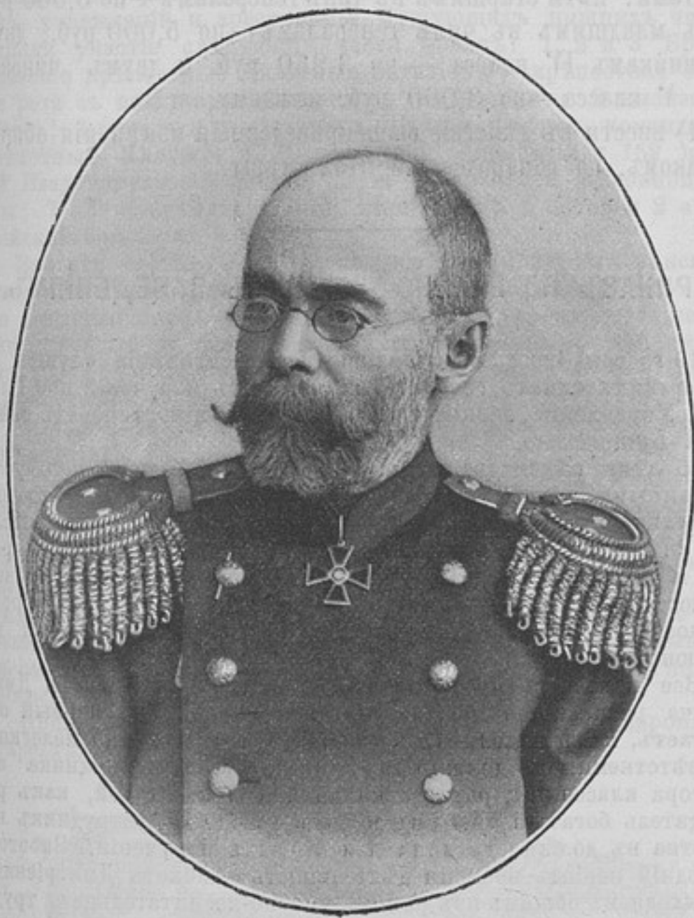
Генералъ для особыхъ порученій при Главн. Управ. Всен.-Учебн. заведеній, генералъ-лейтенантъ