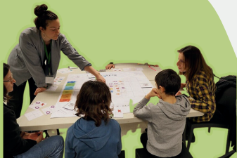
Wikeys aux Journées du Logiciel Libre 2023JdLL (CC BY-SA 4.0)

Le jeu qui vous donne les clefs de compréhension de Wikipédia