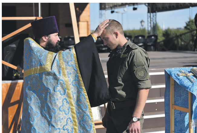
Традиційна «казачка» присяга на свято Покрови у Свято-Володимирському соборі в Херсонесі, 14 жовтня 2018 р.

ни до актові зали Києво-Печерської лаври. Того ж дня у цій церкві поскаржилися, що тисячі українських військових можуть бути позбавлені «духовного окормлення своїми пастирями», котрим «перешкоджає» Генеральний штаб Збройних Сил України (ЗСУ). За словами заступника голови відділу УПЦ МП зі взаємодії з ЗСУ та іншими військовими формуваннями України архієпископа Луки (Винарчу-