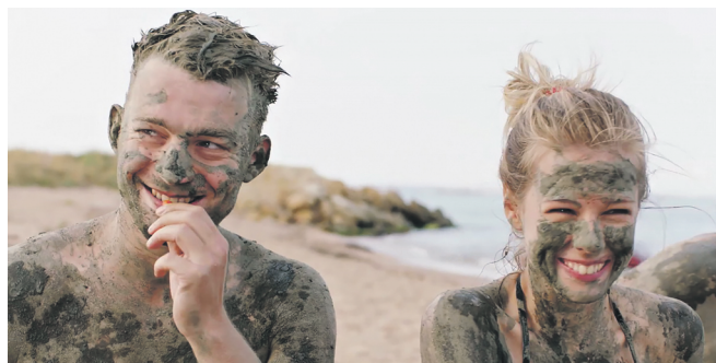
Кадр з фільму

на) й актрису Лауру Давидівну Кеосаян (дочку брата). Росія повертається до традиційних сімейних цінностей.