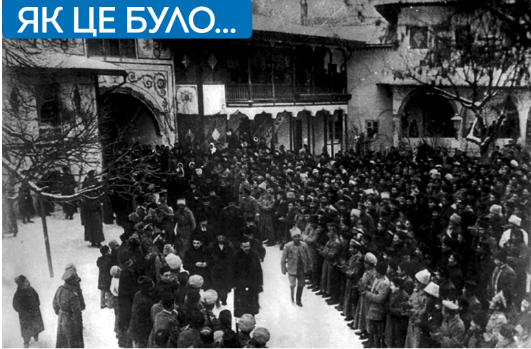
Урочисте відкриття Першого Курултаю кримськотатарського народу в Ханському палаці Бахчисарая