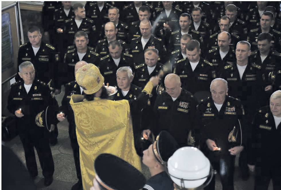
Молебен у штабі ЧФ РФ у Севастополі на день пам'яті «святого праведного воїна» Федора Ушакова