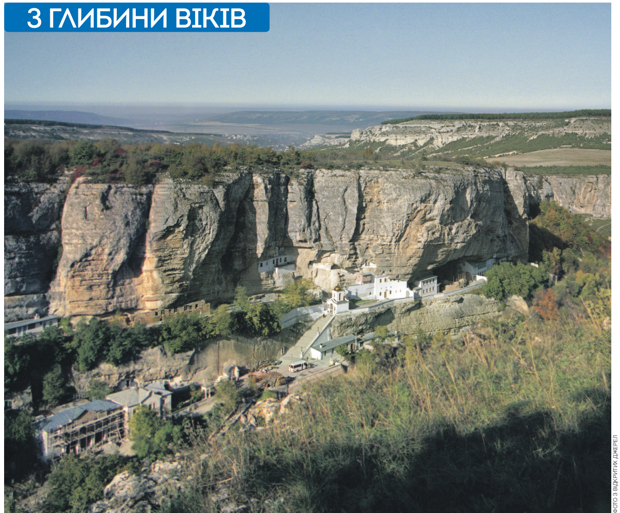
Успенський скит – резиденція Готських і Кафських митрополитів. Сучасний вигляд