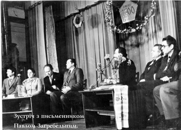
Зустріч з письменником Павлом Загребельним.

І хор ветеранів війни заспівав... Того дня на сцені були 37 учасників, а глядачі в залі аплодували їм стоячи, віддаючи шану цим мужнім людям, яким завдячували за мирне небо, щасливе дитинство і юність — ЗА ЖИТТЯ!