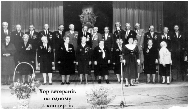
Хор ветеранів на одному з концертів