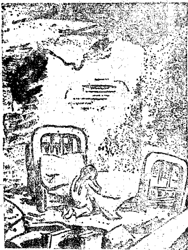
陶百川答 小中周 在炸了 因了 共感 深至 人感 假會 使哥 我比

黨員須知綱領二十條 「大學」新論 論「尾巴主義」 德國的神經戰術 中周「論所謂「遠東慕尼黑」」 小粉「抗戰到底的「底」」 評「抗戰到底的「底」」 警政漫譚（書報春秋） 夜炸德崗記（完） 美日關係回答 陳之邁論出版界（來函） 地方政治的黑暗面（中周信箱） 一周大事日誌