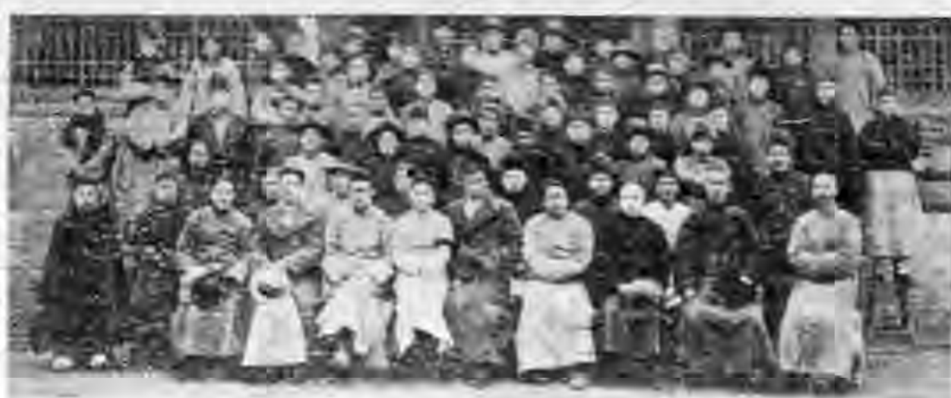
楊村合作社傳習會攝影

現在組織合作社。向當地縣政府辦理登記時。各社投遞呈文如不能親自前往或有特殊困難。可將呈文及其他附件。(如社章。申請登記表。及社員名單等。圖記費四角。可購成郵票附入信封內寄去。)