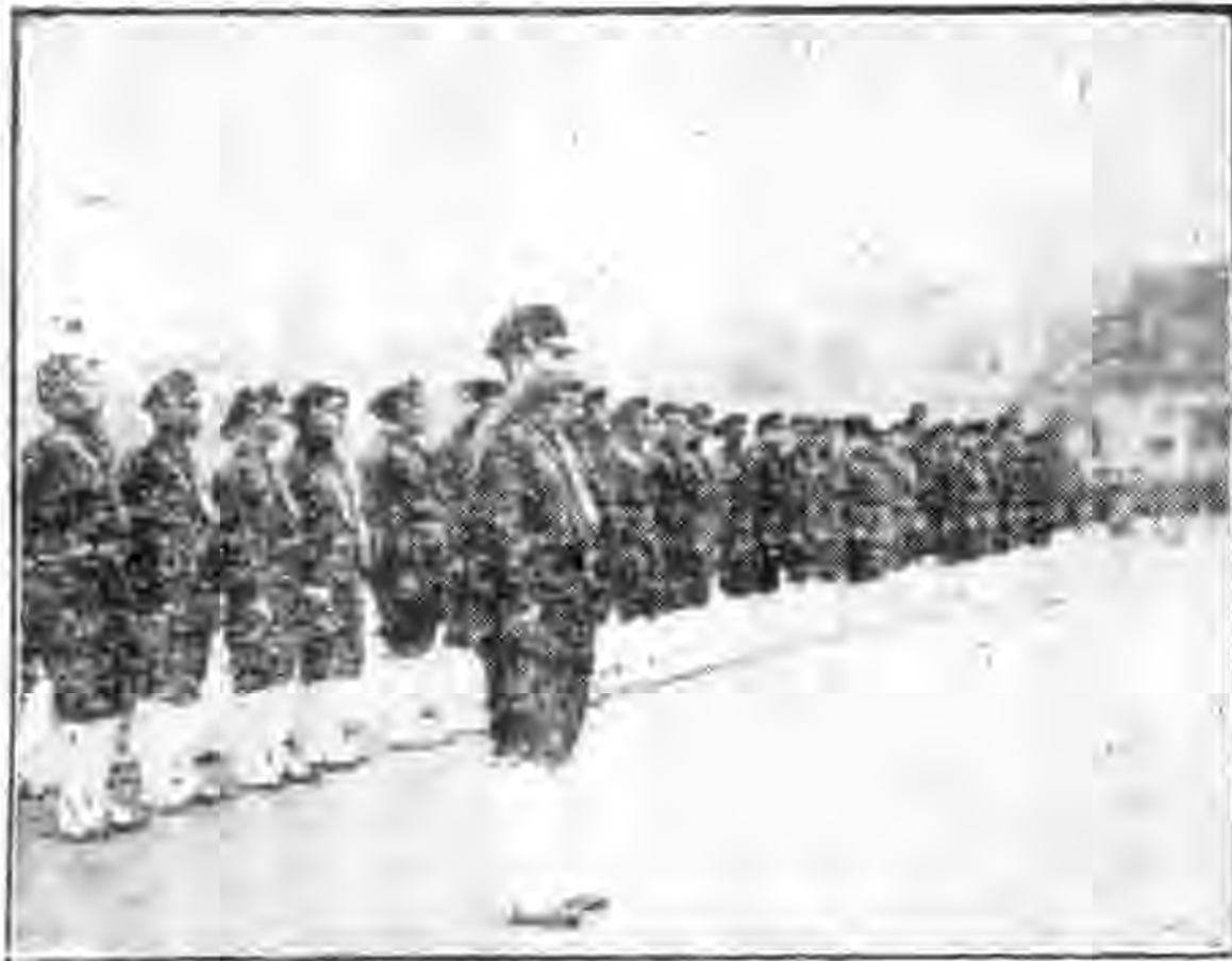
工人軍訓班正立時嚴肅之一斑

在這樣勞動關係的新規定中，最困難的任務，在企業主；即是他不僅僅單爲經營的利益，盡着全力，而且還負着關於「勞動的尊嚴」以形成適合於新國家的勞動條件的責任。因此，爲着社會政策的問題，就其協議，有如次的規定，即由從業員中舉出代表者這一回事，在經營指導者的利益說來，那是被歡迎的。