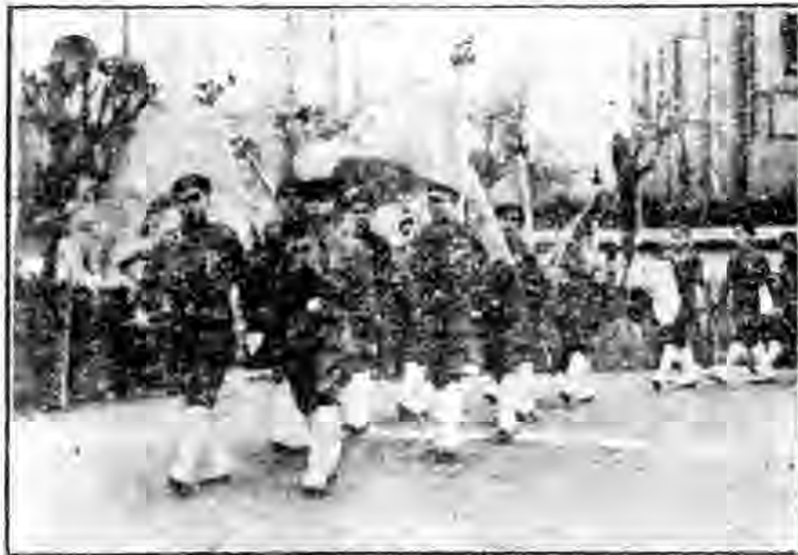
工人訓練班游行時發導者之雄姿

過度勞動 使用學徒操作成年人以上的過度工作，也是見習的事。尤其是工作時間，更談不到，學徒自學業契約訂定後，整個身體，是屬於僱主或業師了，日繼以夜地工作着，沒有一刻休息，這予一個身體發育未全的兒童，自然是極不利的。