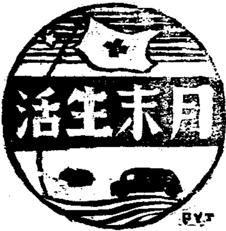
· 號 三 第 ·