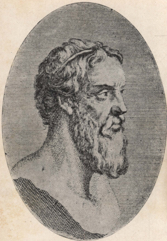
Plato (427 - 347B.C.)