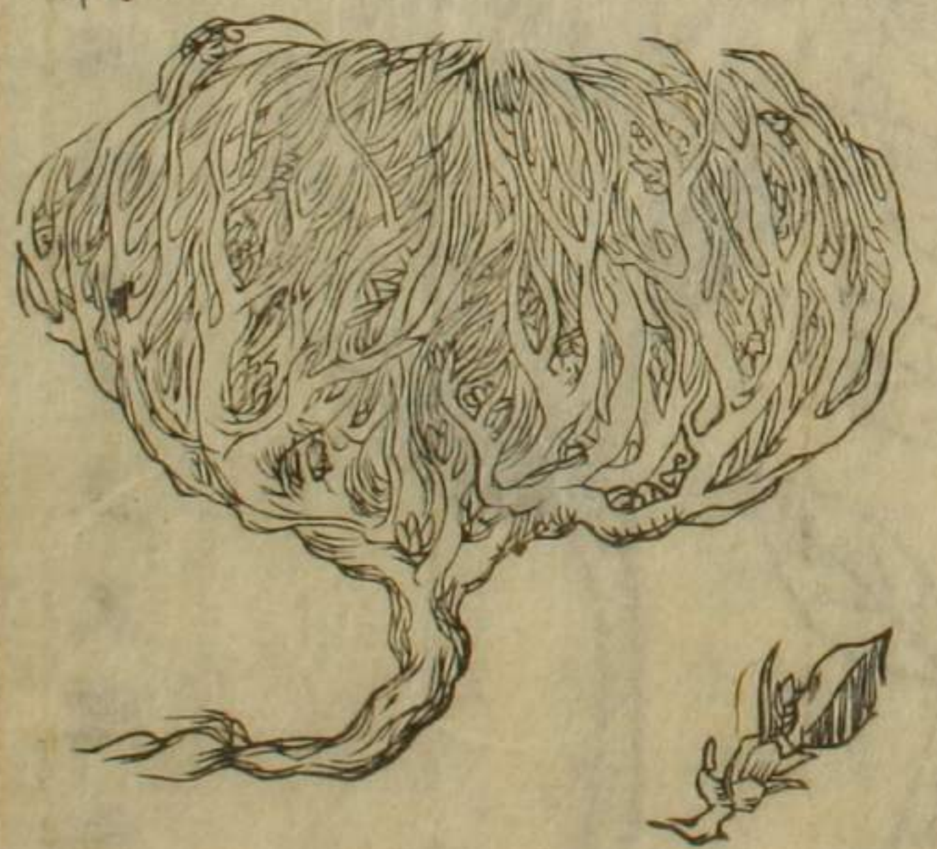
圖 獨度涅烏斯本草所載