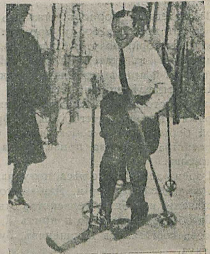
Колли 2-й стартуетъ на 7 в. въ «Моглиивѣ» 28-го февраля.