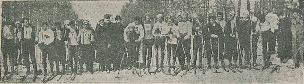
Общая группа участников сстязанія на «первенство» Москвы 28-го февраля.

лена не имѣ, а лицомъ, причастнымъ къ журналу «Къ Спорту».