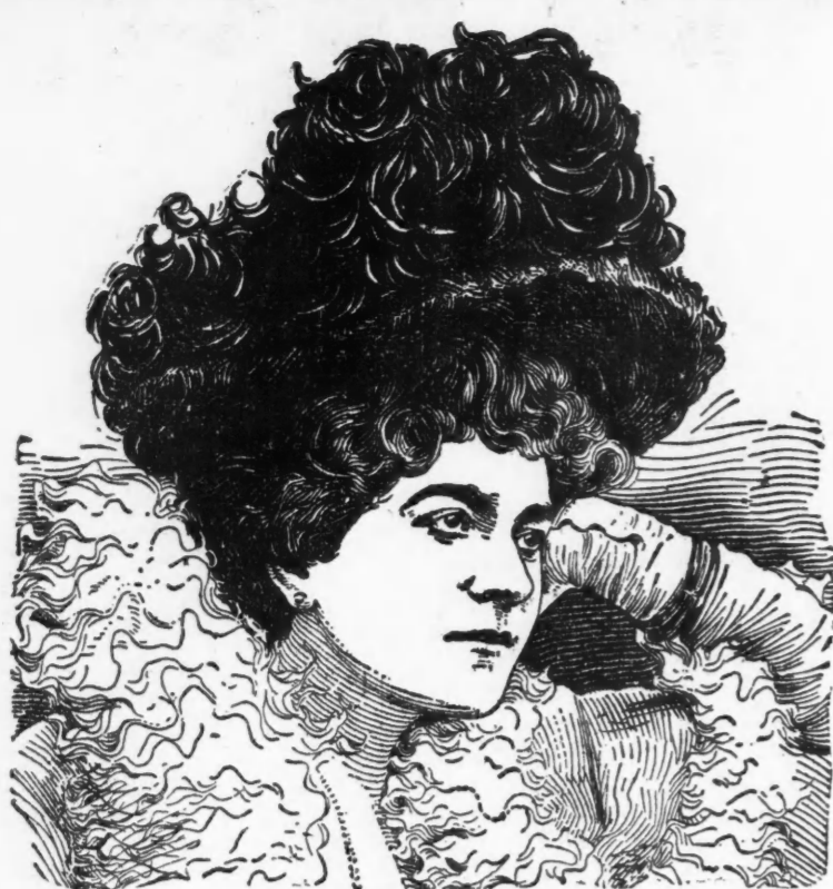
Frau Leslie Carter, die berühmte Schauspielerin von New York City.

„Ich möchte Katarrh nicht um eine Million Dollars haben“, sagt Frau Carter—Peru-na ihr Schutzmittel.