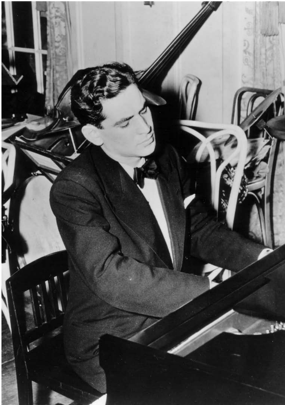
Leonard Bernstein