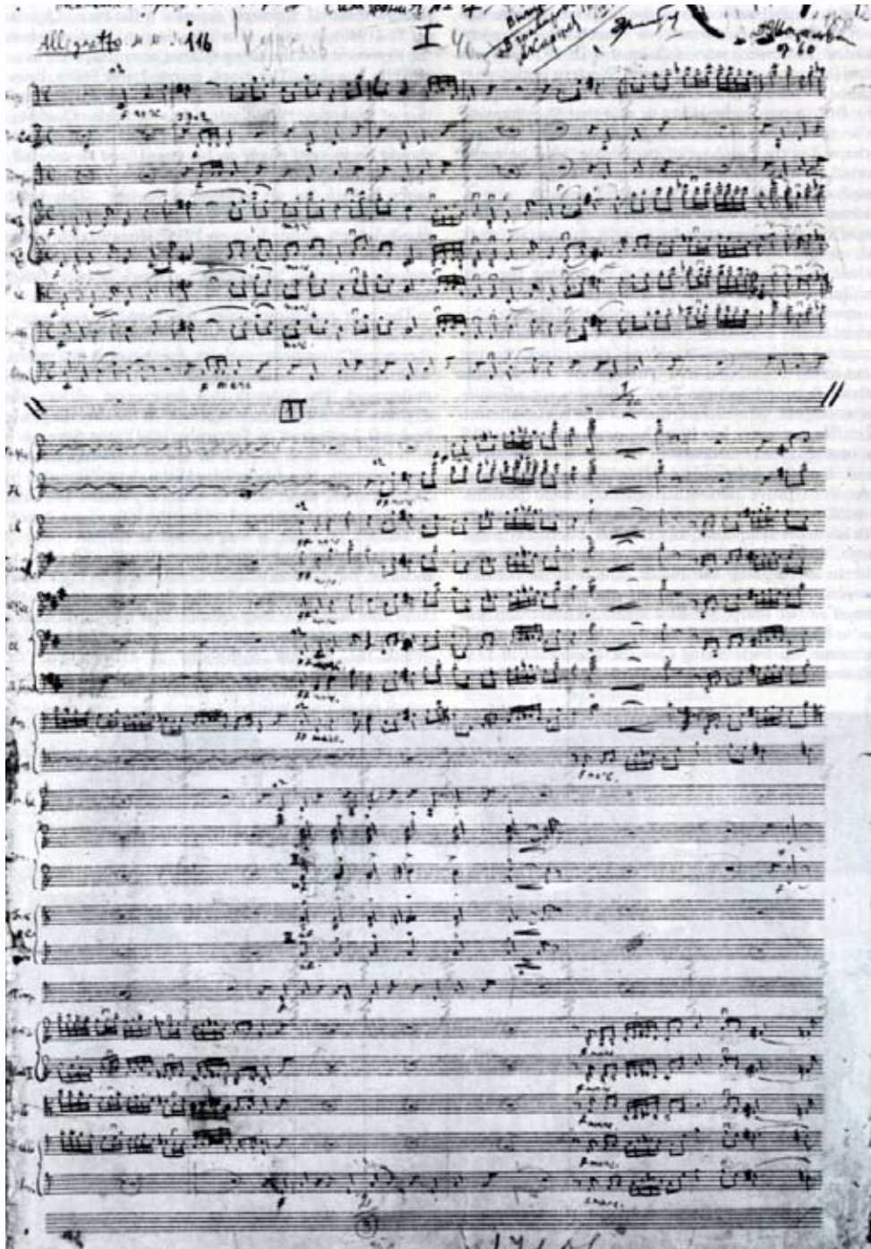
Fragment uit het manuscript van de Zevende Symfonie van Sjostakovitsj, 1941

de herinneringen aan het heroïsche Leningrad tot zwijgen om de verantwoordelijkheid voor de eindoverwinning volledig voor zichzelf op te eisen. Over de gigantische offers van de bevolking werd niet meer gesproken. De dictator elimineerde zelfs de partijleiders van Leningrad, die kort voordien de stad door haar zwaarste beproeving hadden geloodst. Het verhaal van de blokkade van Leningrad moest verdwijnen uit de collectieve herinnering.