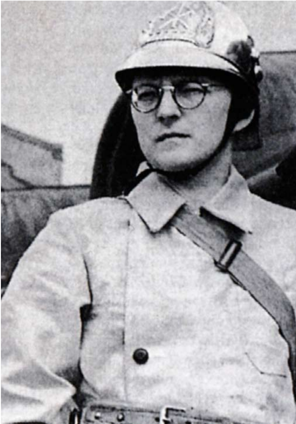
Dmitri Sjostakovitsj als brandweerman op het dak van het conservatorium van Moskou, 1941

woedde overal rondom mij. Ik moest bij mijn volk zijn, en ik wilde het beeld scheppen van ons bedreigde vaderland, ik wilde het graveren in muziek.” Alle grote culturele instellingen van Leningrad worden geëvacueerd. Sjostakovitsj besluit om niet te vertrekken. Op 14 september speelt hij een benefietconcert ten voordele van het defensiefonds. Op 17 september spreekt hij zijn medeburgers toe via de radio: “Een uur geleden heb ik mijn partituur van twee delen van een grote symfonische compositie afgewerkt. Als ik erin slaag om ermee verder te gaan, als het me lukt om de derde en vierde delen te voltooien, zal ik haar misschien mijn Zevende Symfonie kunnen noemen. Waarom zeg ik u dit? Omdat de luisteraars die nu naar mij luisteren zouden weten dat het leven in onze stad normaal verder gaat.”