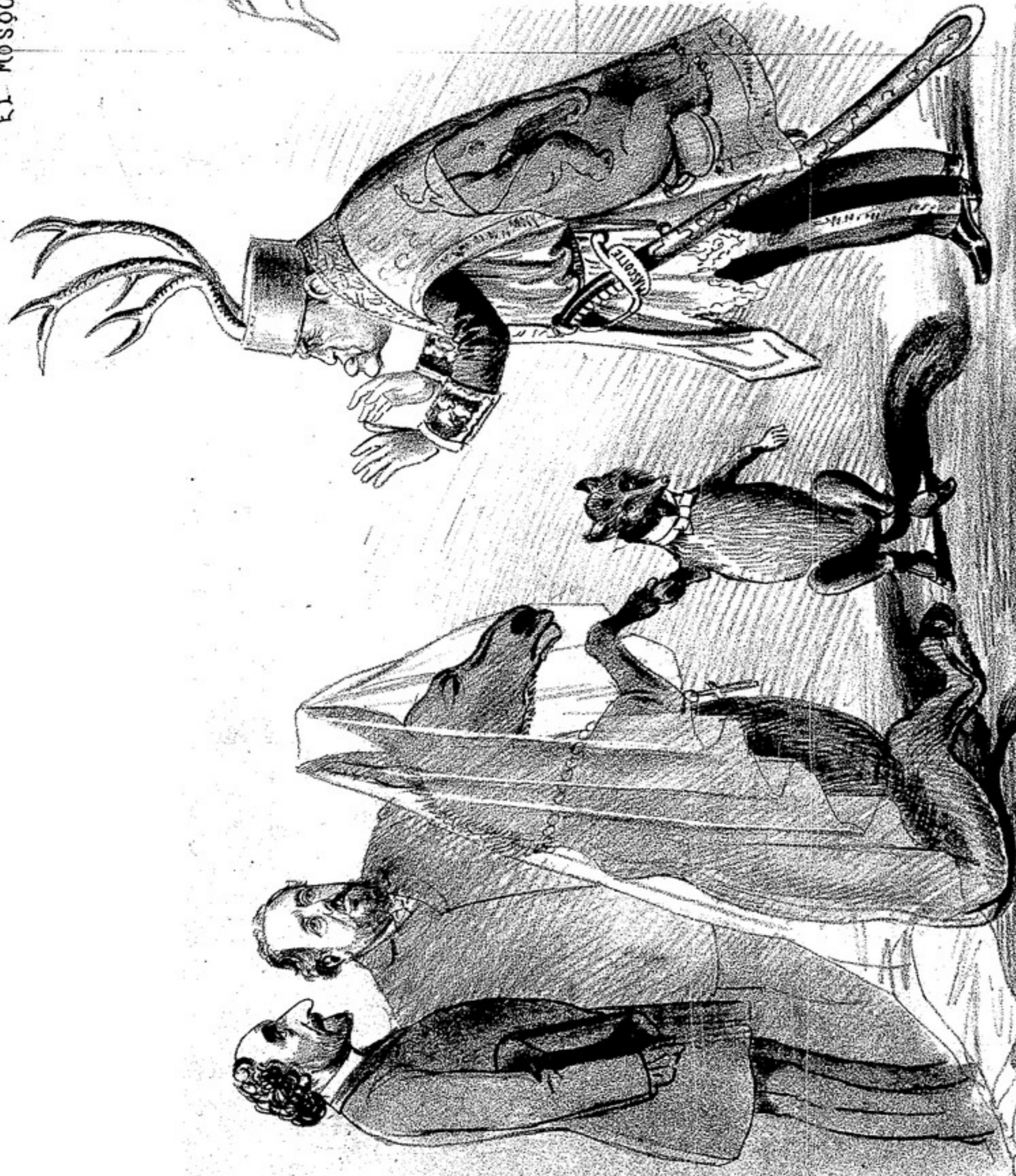
parece que se unen los partidos gorostaguisa y bolinista. Conviene que el Gran Sacerdote de la protección a los animales sea el que detenga este celtore fusion al alboranismo y del oscurantismo.