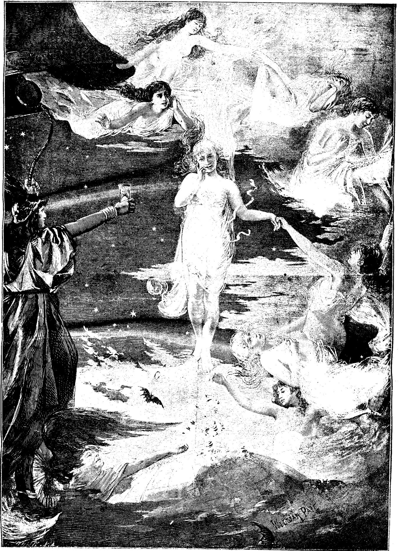
SALUTAREA ANULUI NOU.