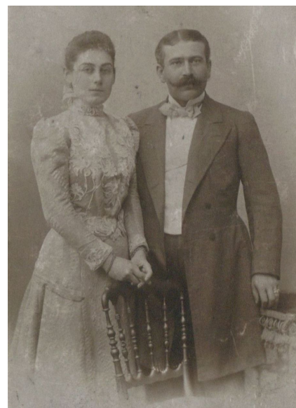
Ryszard Winiarski, Sto Zdarzeń 10*10 , kolekcja Zachęty, cc by-sa