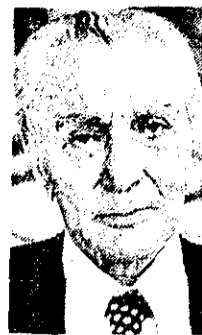
دکتر کریم سنجابی

جبهه ملی ایران مذاکره با دولت شریف امامی را رد کرد و دکتر کریم سنجابی رئیس و دبیر هیأت اجرائی جبهه ملی تأکید کرد که با همکاری دولت ایران، نهاد مشروطیت و مواجبات فساد دولت به هیچ وجه شایستگی ندارند که حکومت موقتی تشکیل دهند. سرگزار کننده انتظامیاتی صحیح و مطابق قانون اساسی باشد. دکتر کریم سنجابی دبیر هیأت اجرائی جبهه ملی ایران ضمن اعلام این مطلب در یک گفتگوی اختصاصی با کیهان، اضافه کرد: حرف بر سر این است که ملت ایران باید به شخص و گروهی که نمندوی حکومت می‌شوند اعتماد پیدا کند و اینها را راه استقرار دموکراسی و راه استقلال ملی ایران مصادق و صمیمی باشد. مادام‌العمر ما را که اجراً منتظر گذریم گفتم افرادی که در این ۲۵ سال لوده به تحریک اساس دموکراسی ایران، نهاد مشروطیت، باعث و بنای انواع فساد بودند و مطالب و شرفهائی مرتکب شدند، در واقع هیچ شایستگی ندارند که حکومت موقتی را بر سرگزار یک انتخابات صحیح تشکیل دهند.