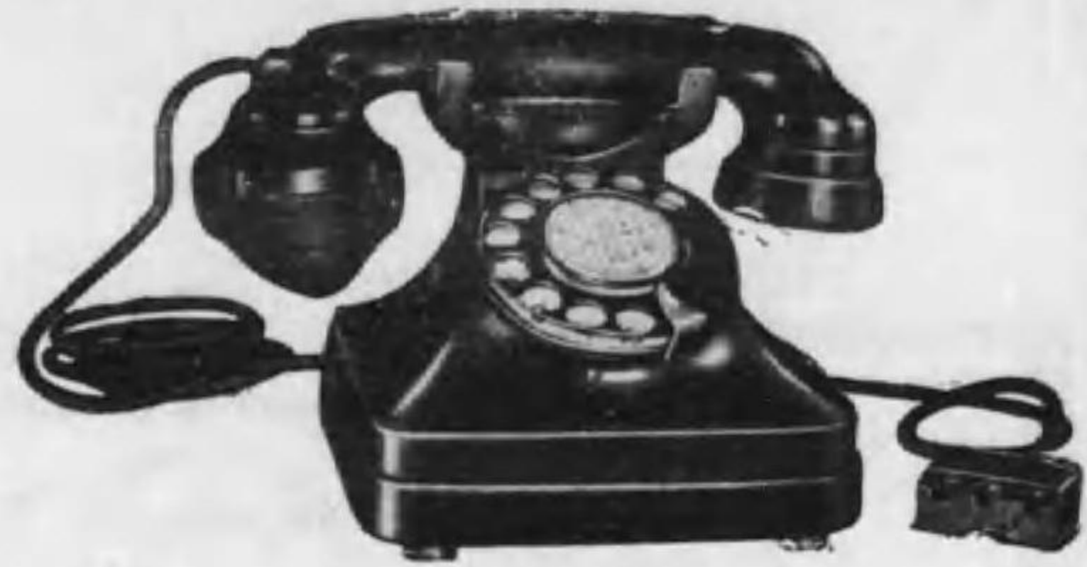
自動式桌上電話機

有線電信電話機及附屬品 無線電信電話機及附屬品 電氣計器及測定器具類 其他電氣機械器具一式 電氣諸工事設計、請負、監督