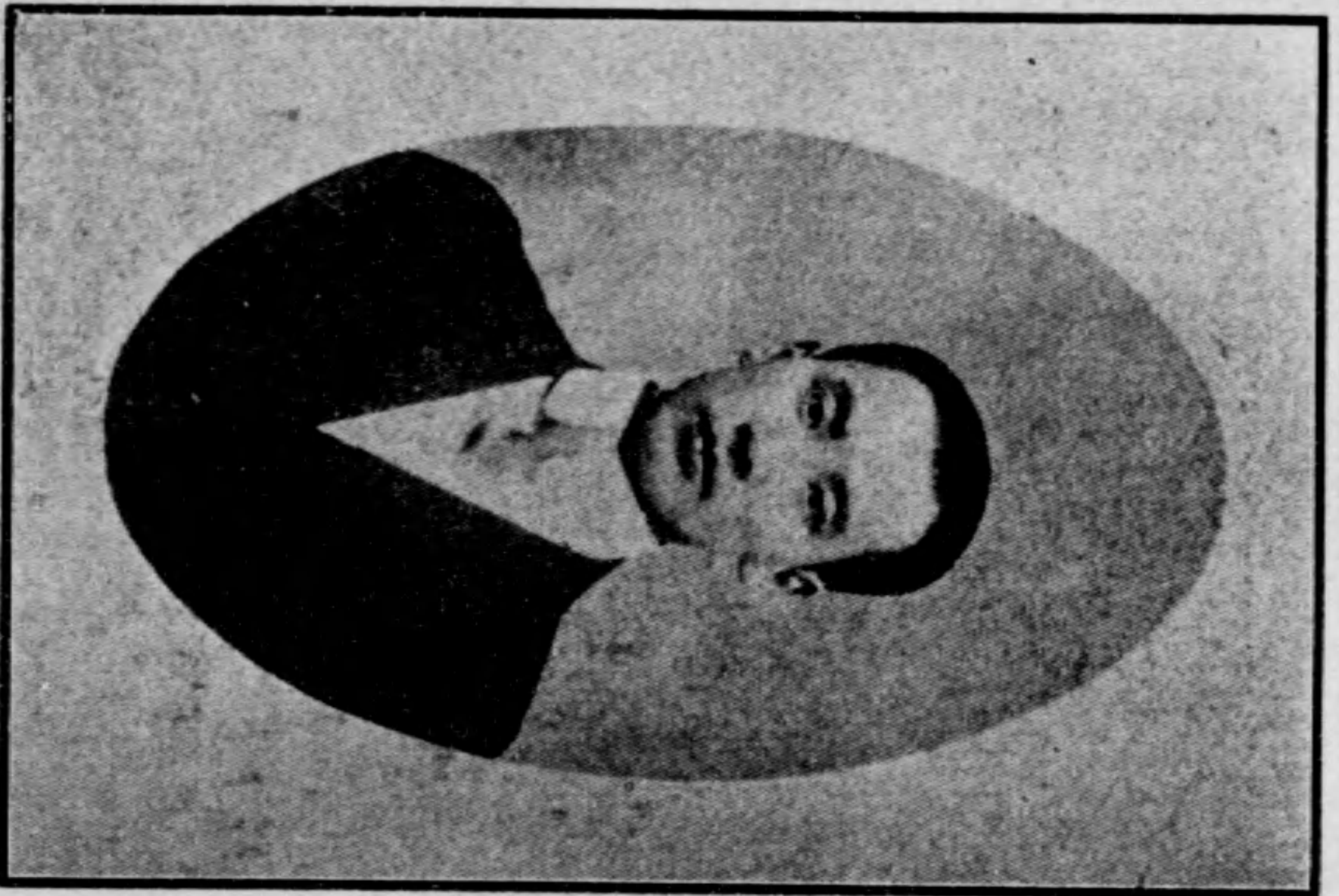
早本日人蘇江君鑿紹王 衆業畢科濟經治政學大田 員委草起法憲員議院議