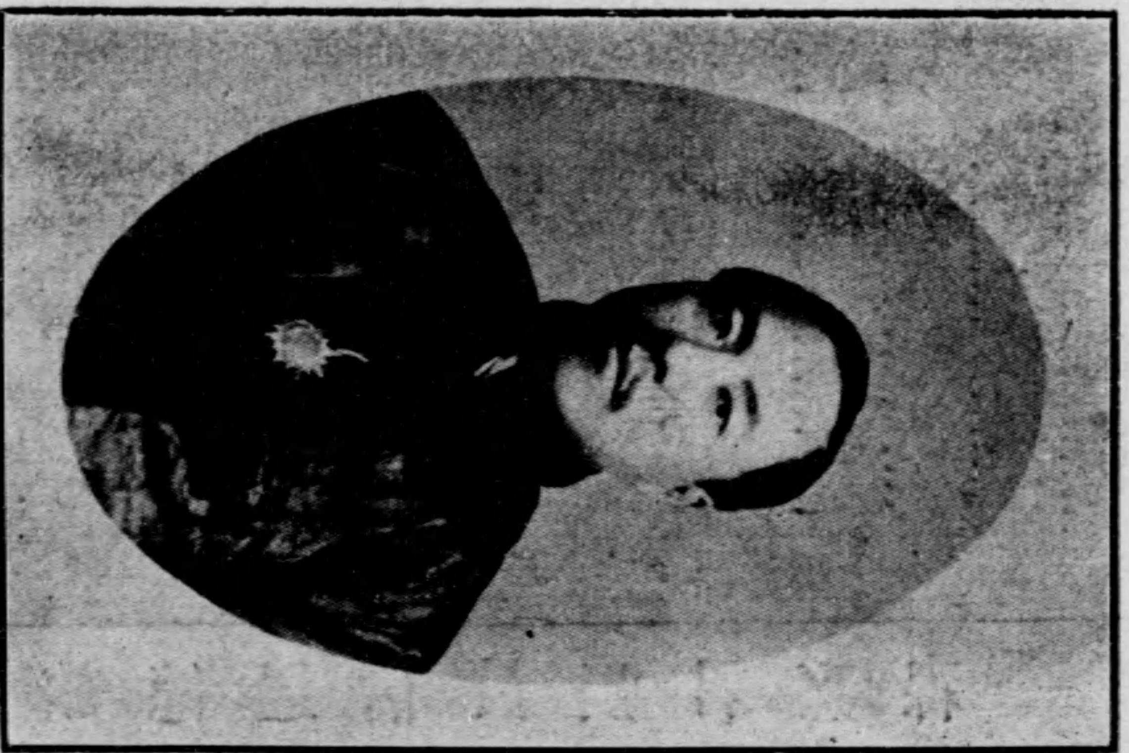
早本日人隸直君秀鍾谷 員議院議衆生學大田稻 員委草起法憲