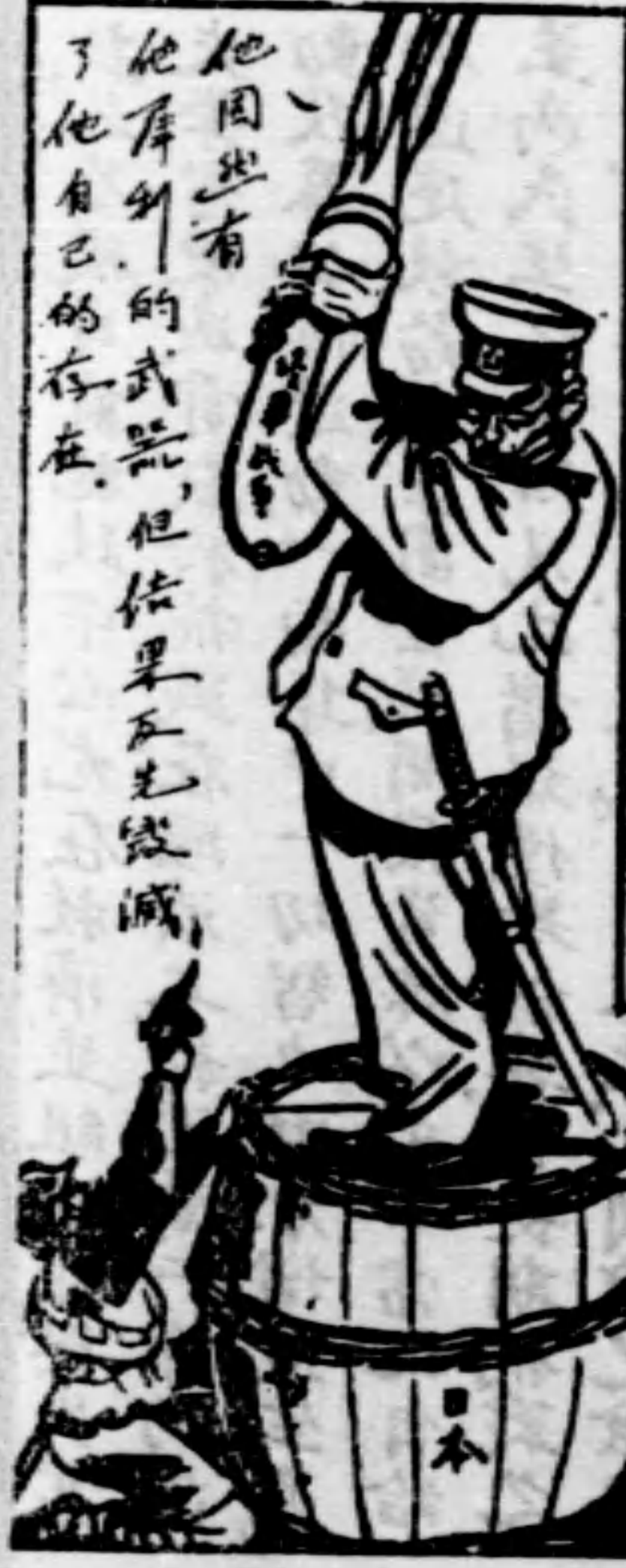
他因出有他所有的武器，但結果反先毀滅了他自己的存在。