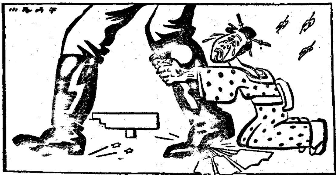
(二)第二幕：蝴蝶夫人失戀了。

人人共知六年以來，即自國社黨執政之後，德蘇政治關係在緊張狀態之中，人人亦知雖兩國立場及政治體系不同，蘇聯政府仍曾努力維持對德國之