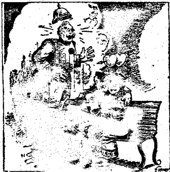
日德親善的悲劇。 (一) 第一幕：心心相印。

反侵略互助公約之締結，如欲發生實效，必須英法蘇三國關於抵抗侵略國進攻之切實軍事步驟成立協定，因此，有一時期不但政治談判，即軍事談判，亦曾在莫斯科與英法代表共同進行，但此項軍事談判亦無結果，緣蘇聯與英法三國共同保障之波蘭，竟拒絕蘇聯之軍事援助，嗣後雖屢曾設法加以克服，但並無成效。且也，談判之經過，並證明英國不但無克服波蘭此項反對立場之意，甚至加以惡意。波蘭之態度將