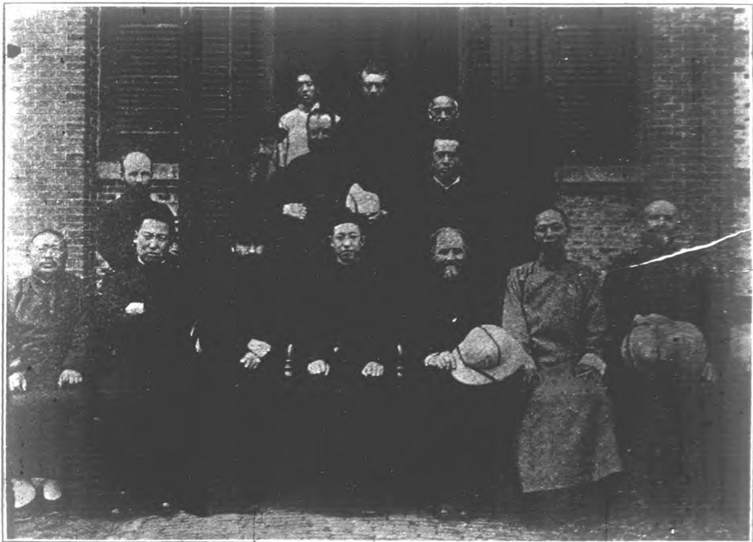
新聖蔡司鐸榮歸故里攝影