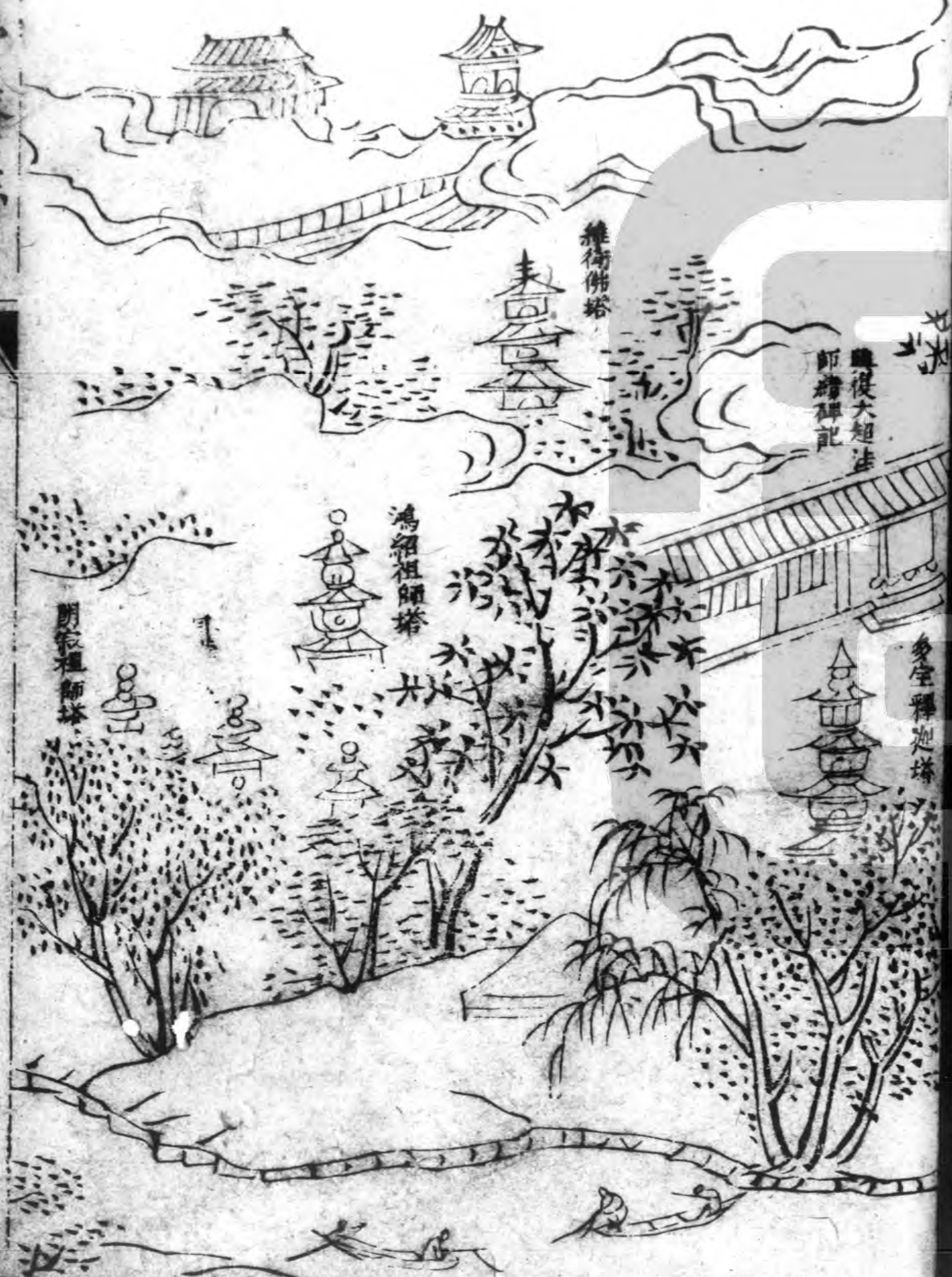
瞻復大超法 師塔碑記