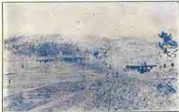
(日五十月三年七十) 影 攝 念 紀 年 週 莊 曉