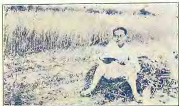
（廿七年六十）影 小 者 著