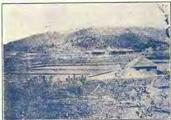
(冬年六十) 景 全 莊 曉