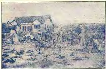
（冬半六十）地 園 關 開 友 朋 小 和 者 著