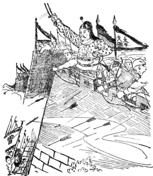
打下紫金山的天保城