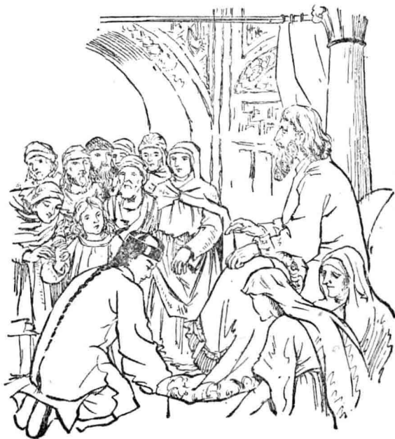
看見一個老人，靠在上面坐着。