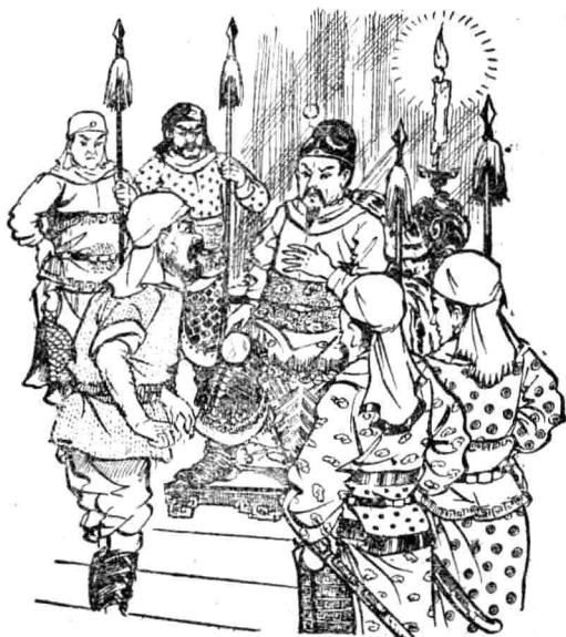
有一個老年的兵士是湖南人