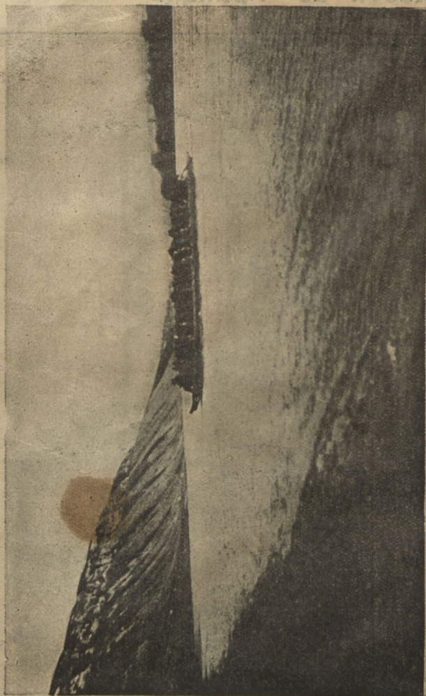
Переправа черезъ Днѣстръ войсковыхъ частей на паромѣ.