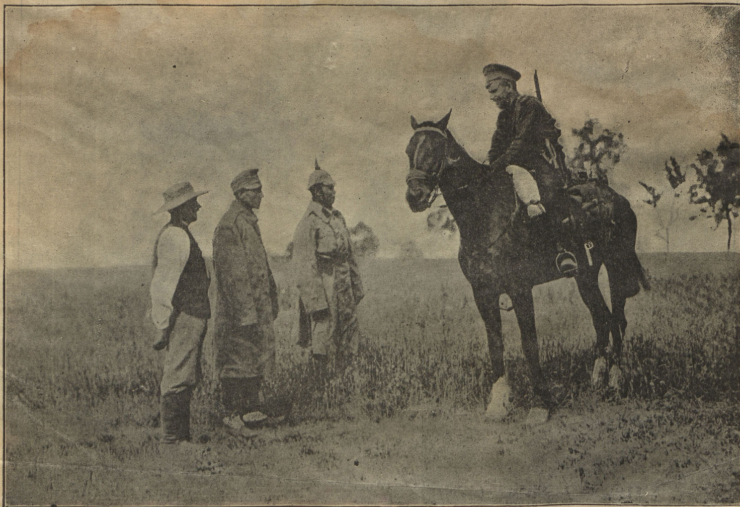
Два дезертира изъ австро-германской арміи.