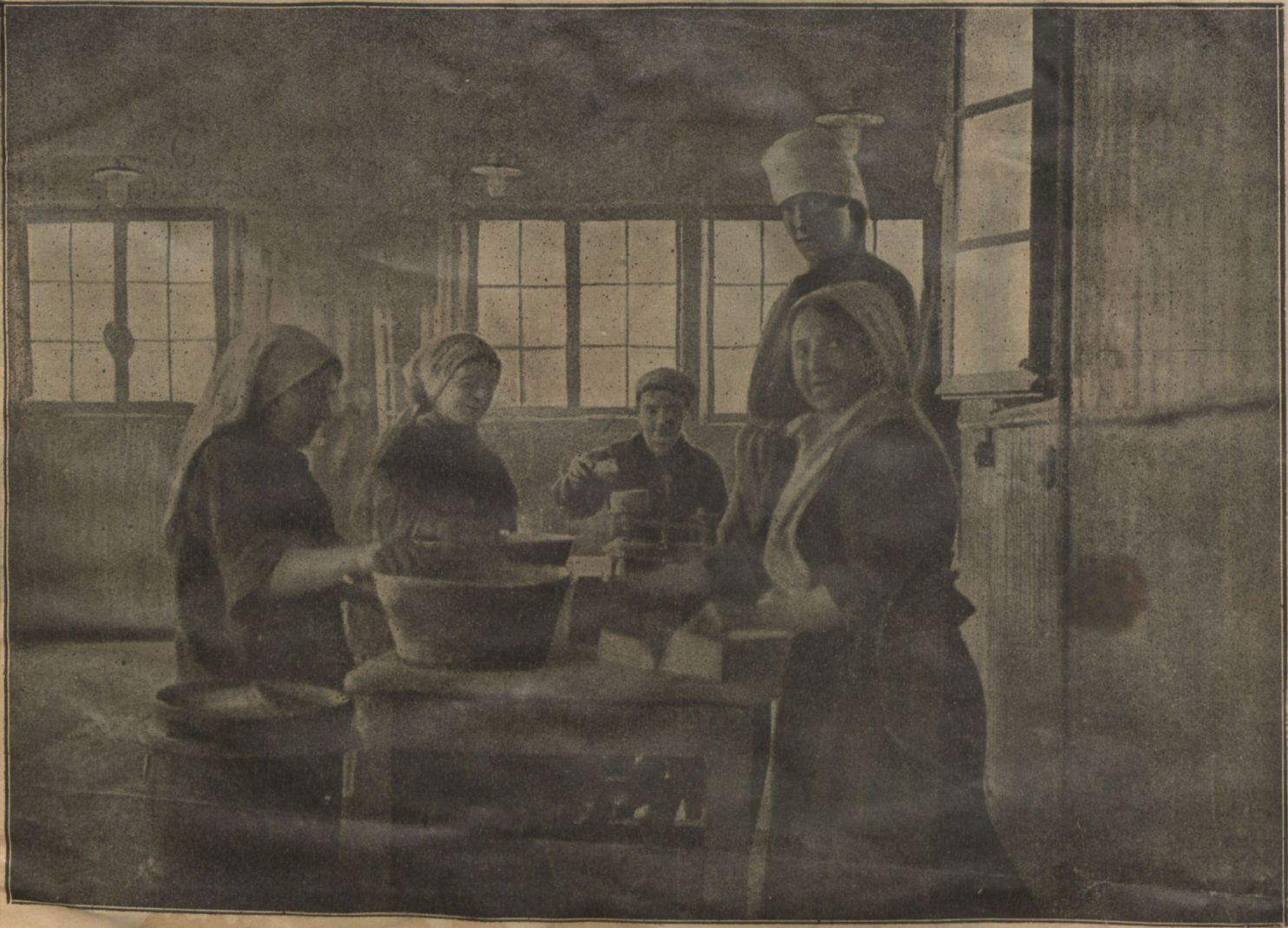
Женщины работают надъ изготовленіемъ бомбъ.