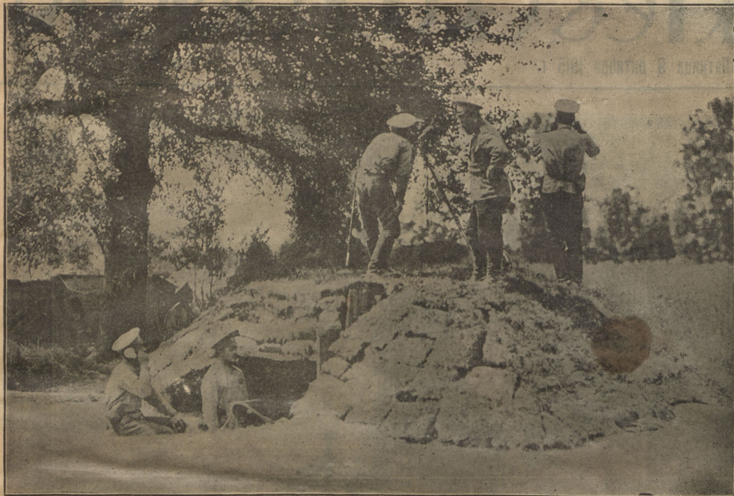
Офицерскій постъ въ замаскированной землянкѣ.