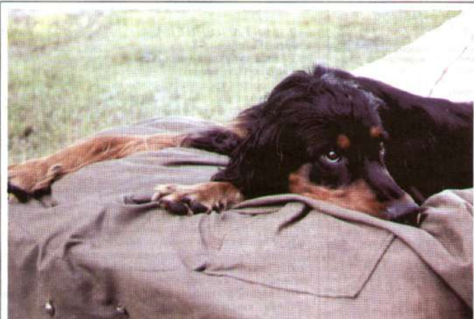
О дають, аж мені цікаво!..