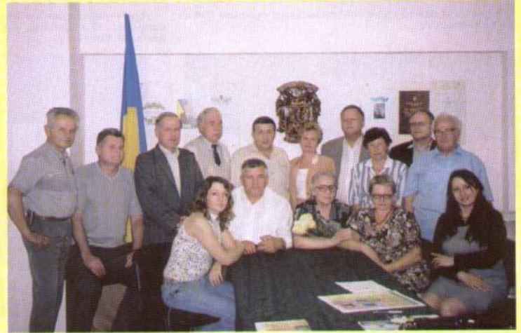
Тісно коло Корюківського активу.