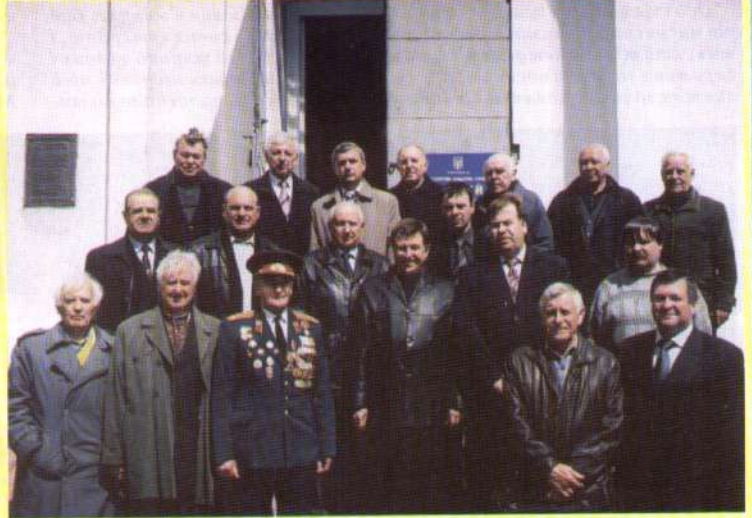
Візне засідання керівників та активістів земляцтва у Козельці.