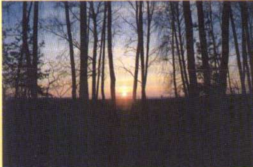
Над Десною сонце сходить.

на те, щоб кожному землякові жилося краще у цей нелегкий час. Отже, кожному із нас буде цікаво перегорнути сторінки свого найближчого минулого, порадити за сподіяне і подумати, що ще зробити для того, щоб авторитет столичного Чернігівського земляцтва невпинно зростає. Ми самі пишемо свою історію, ми гідні її.