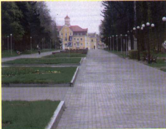
За кілька хвилин брукувкою древнього Чернігова пройдуть столичні земляки.