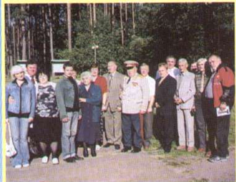
Менська земля відкриває обійми.