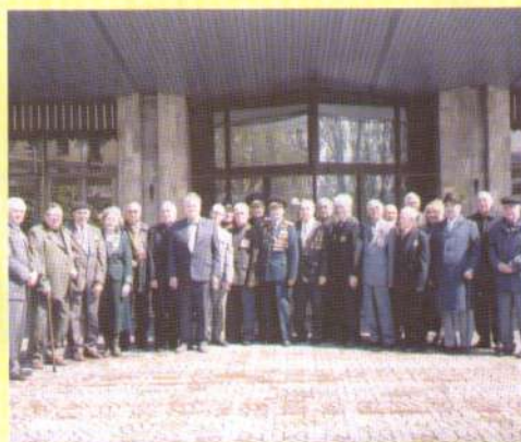
І знову їх зібрав переможний травень.