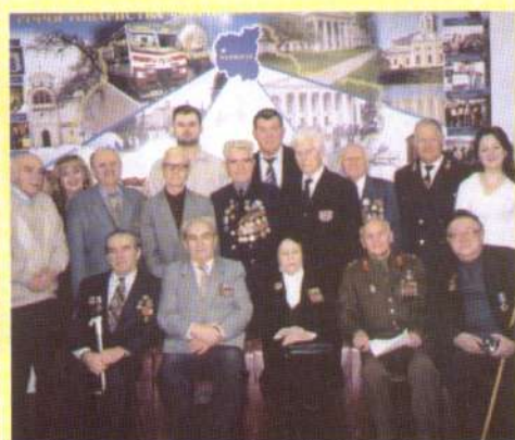
Земляцька гвардія із молоддю братається.