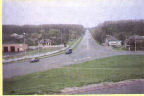
До побачення, Чернігове! Дорога на Київ.

Сторінки літопису підготував Василь Устименко