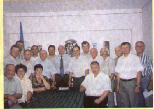
Радяться керівники регіональних відділень.