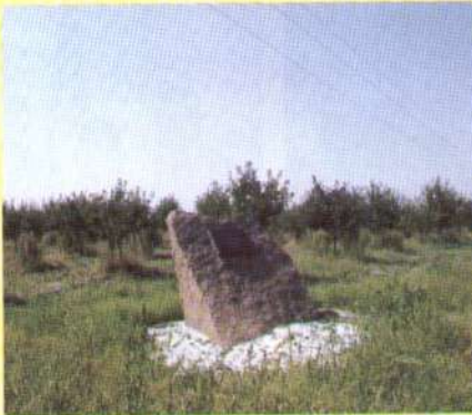
Буде сад – буде Україна.