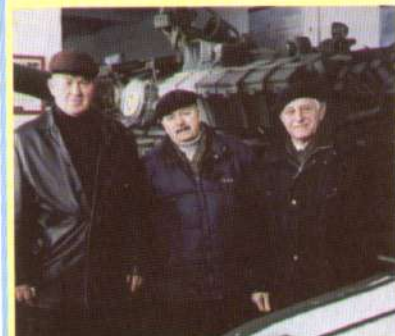
Мирні танки мовчать у навчальному центрі Десна.