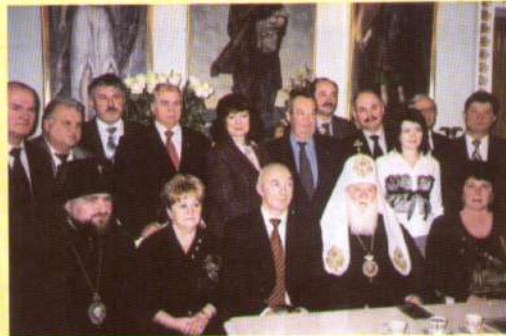
Чернігівське земляцтво, як координатор Ради всіх столичних земляцтв, організувало зустріч їх керівництва із Патріархом України-Руси Святійшим Філаретом.