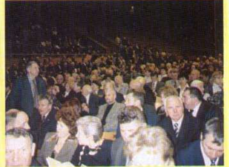
У Палаці спорту ніде яблуку впасти.