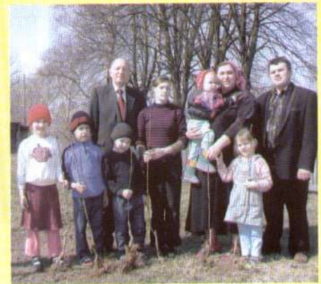
Козилівські діти посадять сад свого майбутнього.