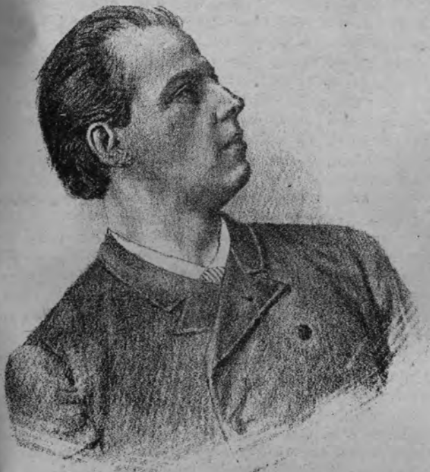
М. В. Салтыковъ.