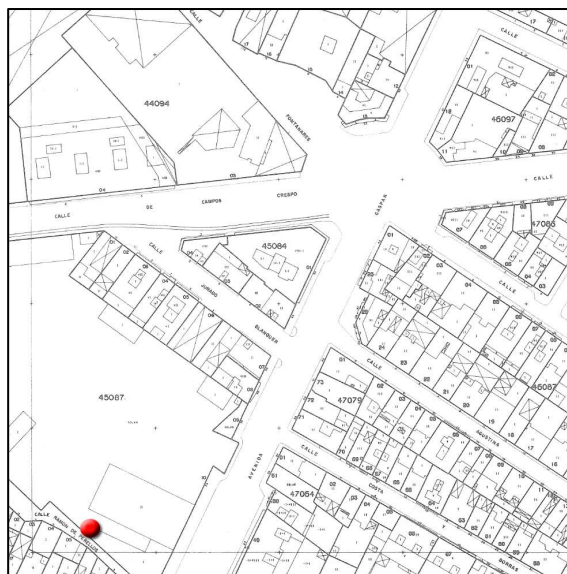
Cartográfico C.G.C.C.T 1980