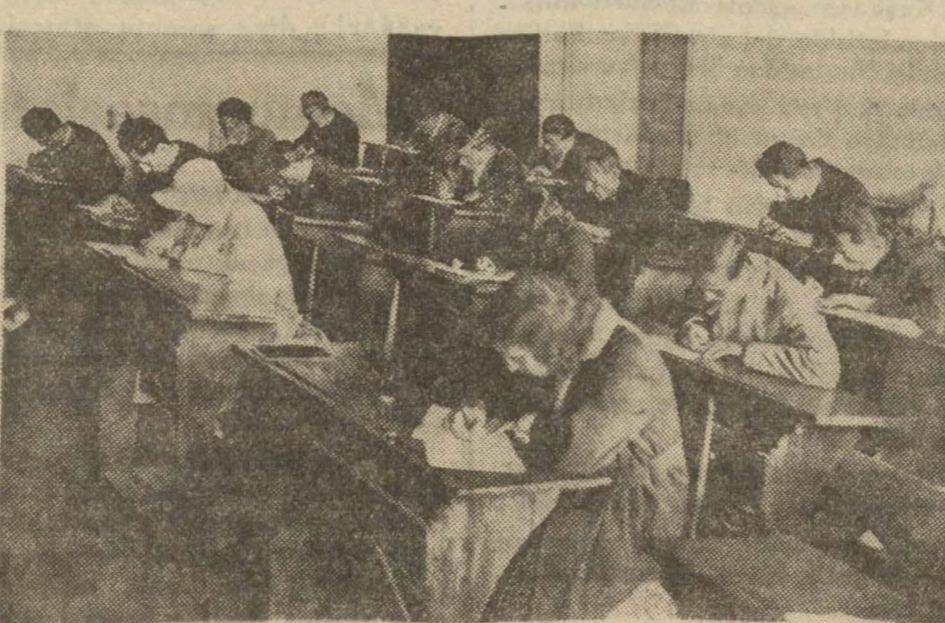
Orta mektep muallimliği imtihanlarından bir intiba

Dün yüksek muallim mektebinde orta mektep muallimliği imtihanlarına başlanmıştır, dün yalnız riya-yatı ve fiziki ilimler zümresinden imtihan yapılmıştır.