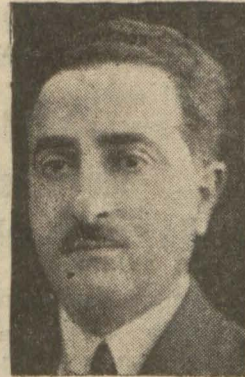
Bazı müntehibi senilerin firka disiplinine muallif olarak rey vermedikleri

«— Ankarada Fırka Alâettin Cemil B. nin idari teşkilâtına dair bazı esaslar hakkında Kâtibi Umumi ile görüştük. Bu işlere ait bazı yeni emirler de telâkki ettim. Bu meyanda Alâettin Cemil Beyin intihabı hakkında da Kâtibi Umumilikçe istenilen bazı malumatı arzettim. Bir akşam gazetesinin muhabiri tarafından bana atfen çekilen telgraf yanışı. Bu muhabir Ankara'da bana (Mabadi 4 üncü sahifede)