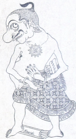
|| ලිංගික ආශ්‍රිත ප්‍රදාය සංස්කෘතියේ ස්වභාවය සහ නිදහස ||

ලිංගික ආශ්‍රිත ප්‍රදාය සංස්කෘතියේ ස්වභාවය සහ නිදහස ලිංගික ආශ්‍රිත ප්‍රදාය සංස්කෘතියේ ස්වභාවය සහ නිදහස ලිංගික ආශ්‍රිත ප්‍රදාය සංස්කෘතියේ ස්වභාවය සහ නිදහස