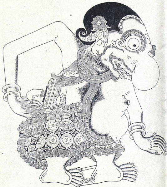
|| ලිංගික ආශ්‍රිත ප්‍රදාය සංස්කෘතියේ ස්වභාවය සහ නිදහස ||

ලිංගික ආශ්‍රිත ප්‍රදාය සංස්කෘතියේ ස්වභාවය සහ නිදහස ලිංගික ආශ්‍රිත ප්‍රදාය සංස්කෘතියේ ස්වභාවය සහ නිදහස ලිංගික ආශ්‍රිත ප්‍රදාය සංස්කෘතියේ ස්වභාවය සහ නිදහස