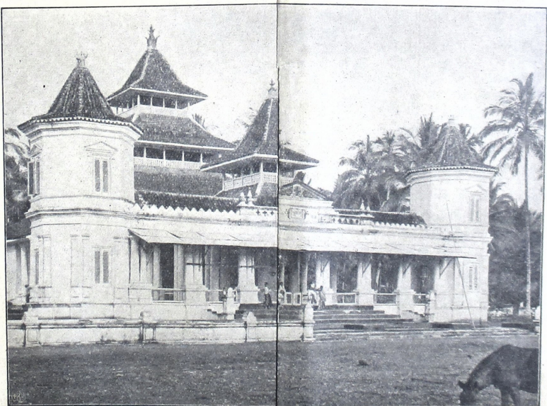
ပုဂံကျေးရွာ၏ အကျဉ်းချုပ်ဖော်ပြချက်