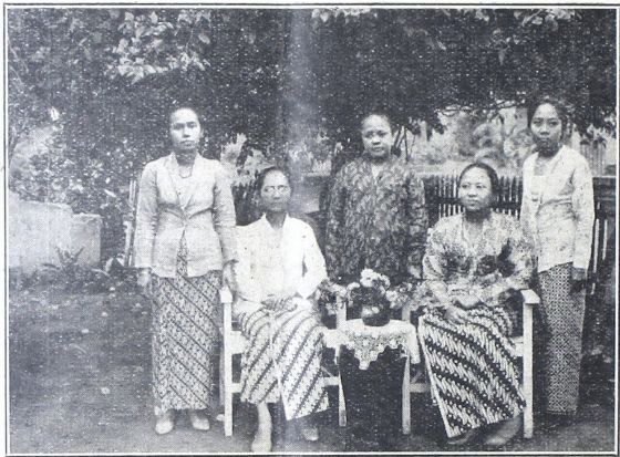
ပုဂံပြည်ရှိ အိန္ဒိယသမားတို့၏ အိမ်ထောင်စုပုံရိပ်။ အဘကုမ္ပဏီ၊ အဘကုမ္ပဏီ၊ အဘကုမ္ပဏီ၊ အဘကုမ္ပဏီ၊ အဘကုမ္ပဏီ

ပေးပါ သူ့အဖို့ အကဲခတ်စာပျံ့ ပေးပါ သူ့အဖို့ အကဲခတ်စာပျံ့ ပေးပါ သူ့အဖို့ အကဲခတ်စာပျံ့