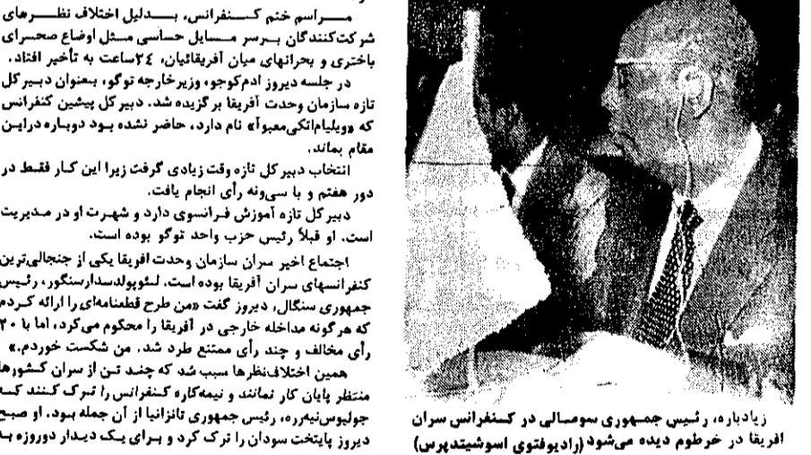
زادبارة، رئیس جمهوری سوسیالی در کنفرانس سران افريقا در قروم دیده می‌شود (زادبوتوی اوسویشته پریس)

قروم - خبرگزاری فرانسه - پایانه کنفرانس سران کنفدراسیون افريقا که از روز ۱۸ ژوئیه در پایتخت سودان تشکیل شده بود، عصر دیروز پایان یافت درحالیکه سادات ژنرال جعفر النمیری، میزبان کنفرانس و رئیس اجرائی سازمان وحدت افريقا، کار کنفرانس بسیار سازه شده بوده است.