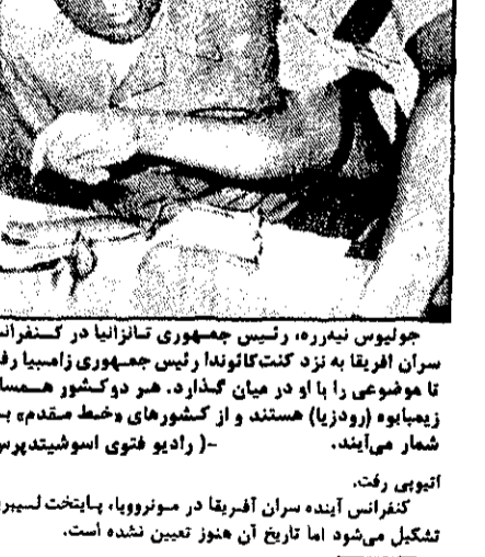
زادبارة، رئیس جمهوری سوسیالی در کنفرانس سران افريقا در قروم دیده می‌شود

سازمان آزادی احزاب در مصر اعلام کرد که در ماه دسامبر گذشته در طرابلس پایتخت لیبی تاسیس شد. سرپرست اعلام داشت که سرپرست سادات را در روز ۲۰ مرداد در بغداد حاکم حاکم خواهد کرد و اعلام داشت که باید هر قدر عربی اجازه داده شود تا بزیردست سادات را بکشد.