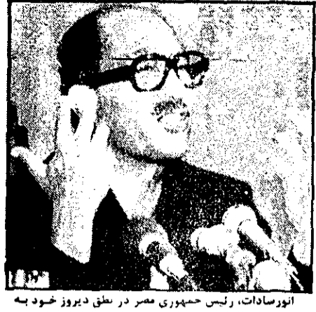
انور سادات، رئیس جمهوری مصر در نطق دیروز خود به مناسبت سالروز انقلاب مصر در دیدار از روزنامه‌ی اوسویشته پریس

قاهره - خبرگزاری فرانسه - روزنامه - انور سادات، رئیس جمهوری مصر اعلام کرد که تصمیم گرفته است حزب سیاسی مستقلی ایجاد کند و خود رهبر آن باشد. رئیس جمهوری مصر این موضوع را در نطقی که به مناسبت سالروز انقلاب مصر ایراد کرد، اعلام داشت. سادات در نطق خود آشکار ساخت که تعداد احزاب سیاسی مصر افزایش خواهد یافت.