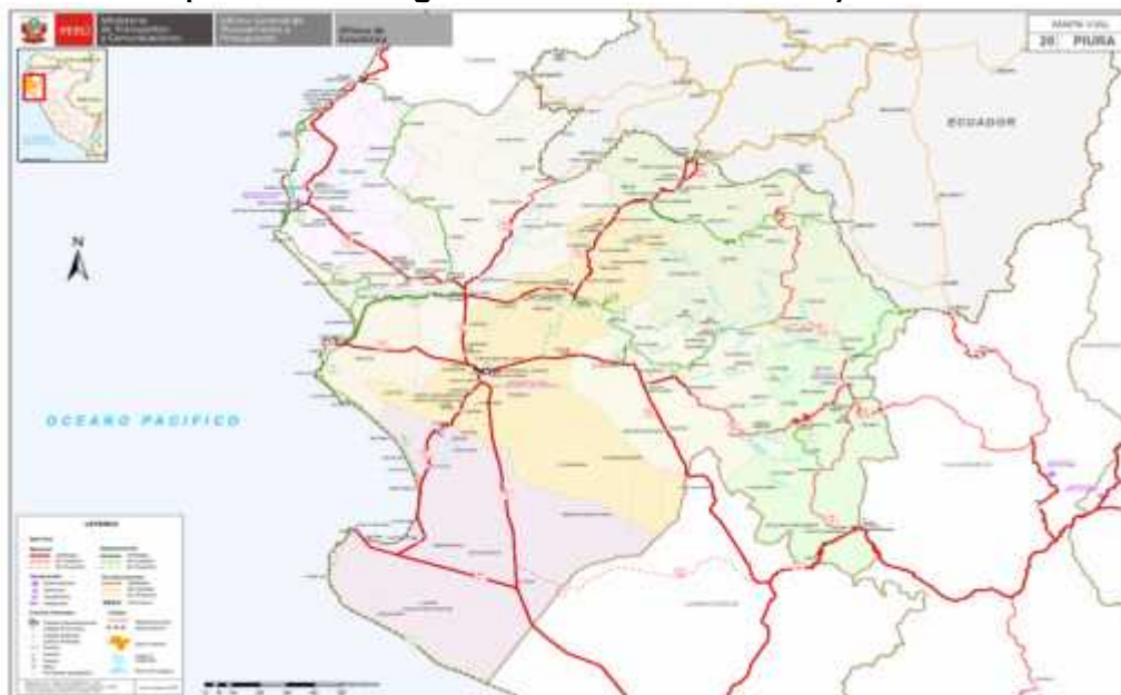
Mapa Vial de la Región Piura con sus Provincias y Distritos

El sistema de transporte y la red vial en la cuenca, está conformada básicamente por trochas carrozables y servicios de transporte de regular calidad debido a su geografía, la cual es variada y se caracteriza por lo accidentado de su suelo. Las trochas se encuentran en deficiente estado de conservación, sin mantenimiento continuo, agudizándose el problema en la época lluviosa, donde se restringe el tránsito, causando aislamiento de los centros poblados con la capital de su distrito y/o provincia, el distrito mantiene unidas a sus ciudades principales mediante su carretera principal, cumpliendo un rol importante para la comunicación e intercambio comercial a nivel interdistrital.