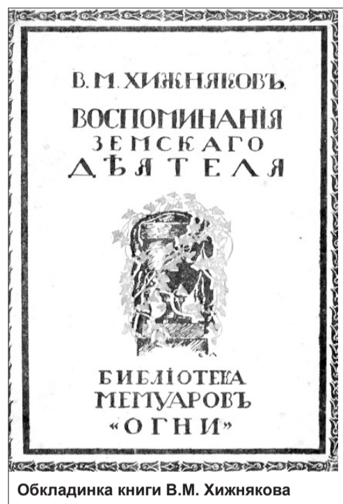
Обкладинка книги В.М. Хижнякова

Перебуваючи у складі державного маєтку, Ситняки належали рожівським старостам, які від звичайних поміщиків відрізнялися лише тим, що отримували право власності на обмежений у часі термін. А їхні методи ведення господарства в маєтках не відрізнялися від інших. Так, 1840 року дружина надвірного радника Григорович скаржилася на поміщика с. Ситняків Пухальського, який заборонив їй молотити хліб.