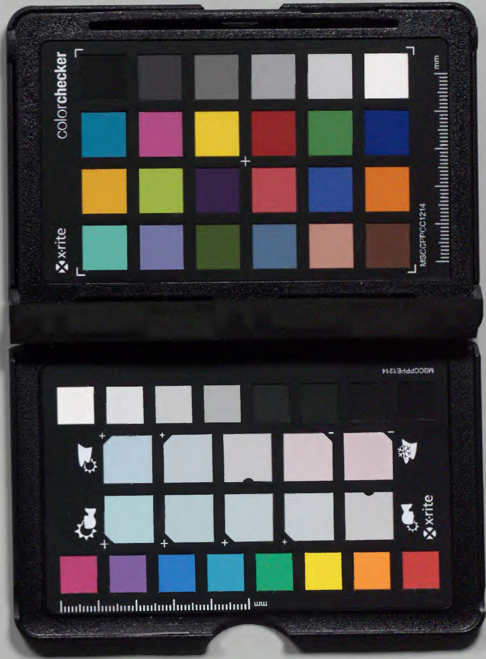
裏面記載のない箇所は省略