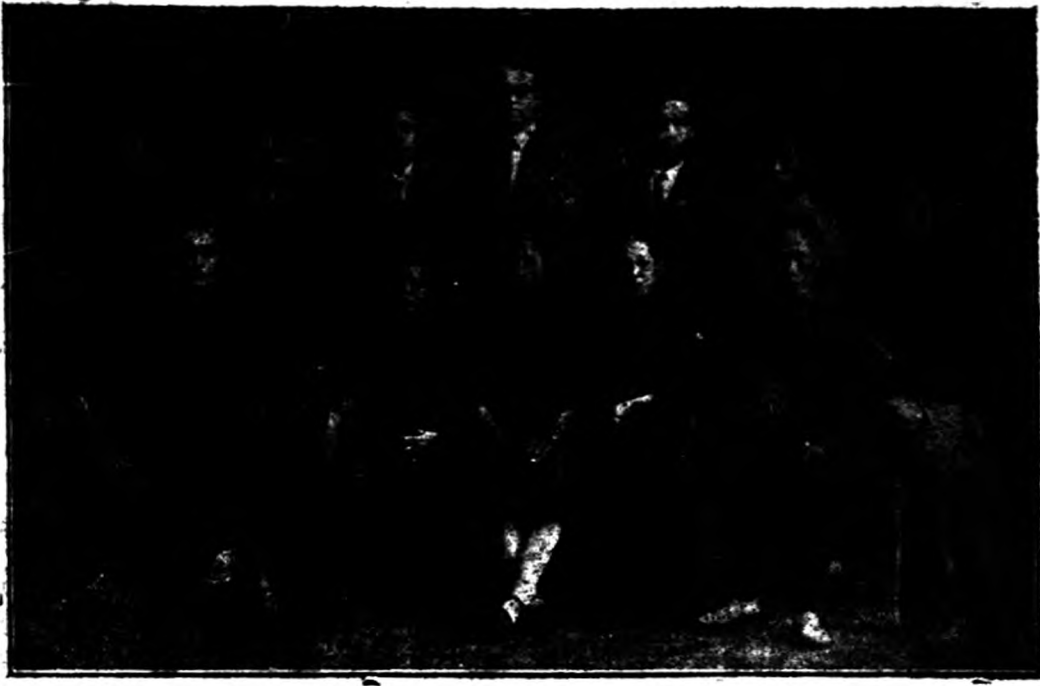
正統聖經學校第二屆教職員學生攝影